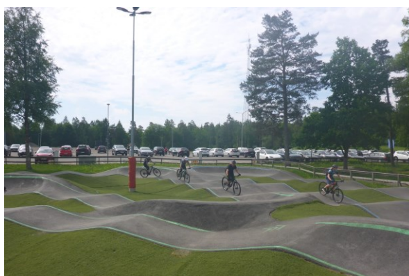
MTB i Skövde