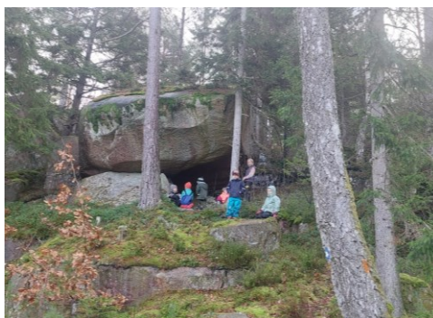
Grottan vid Hedum vatten