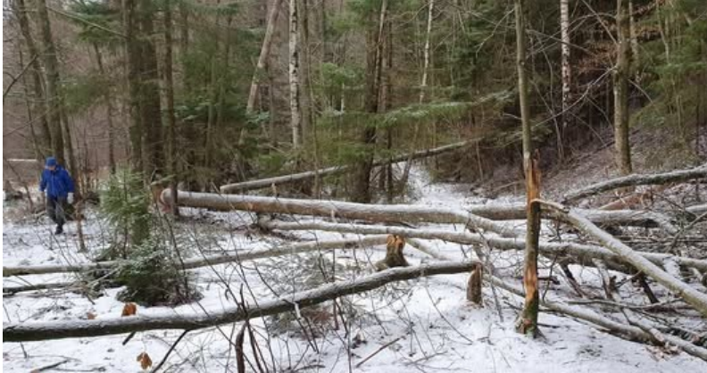
Bäverfällda träd vid Björöd

Föreningen sköter Bohusleden föredömligt. Märkning, spångbygge och röjning har genomförts. Uppdraget sköts på uppdrag från kommunen som ger oss ett årligt bidrag. Kommunen upprättar en årlig skötselplan och kvalitetssäkrar leden 2 ggr/år.