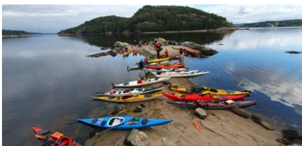
Strandhugg Ärte, Gullmarn