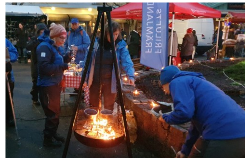
Ledare som var på plats på Jul i Munkedal