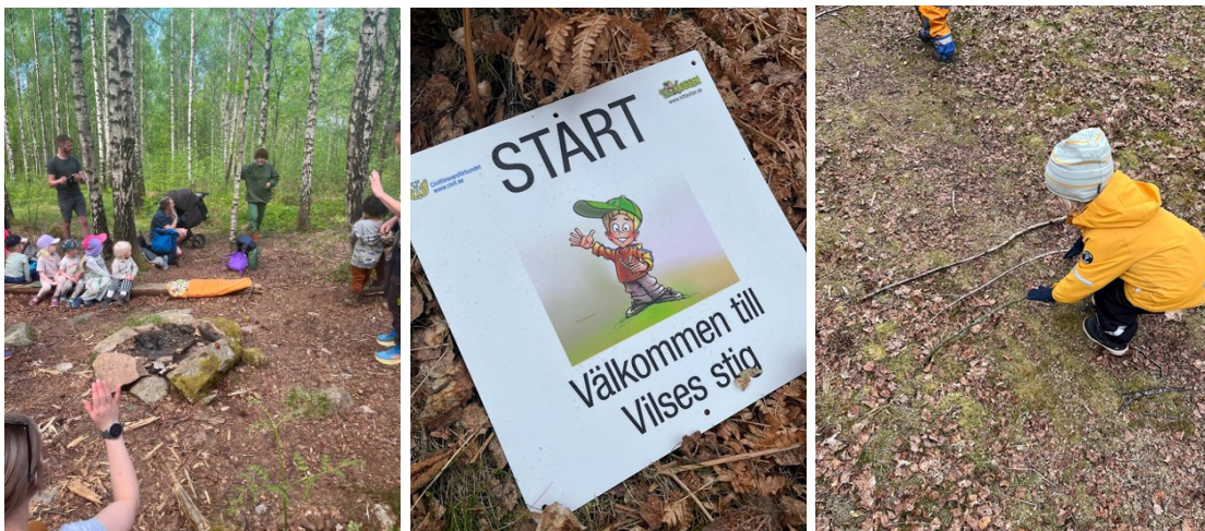
Korvgrillning med besök av Skogsmulle. Vår kompis Vilse lärde vi oss att göra ett stopptecken på stigen, genom att lägga tre kvistar på rad.

Vid varje träff deltog ca 10-20 barn och deras medföljande vuxna.