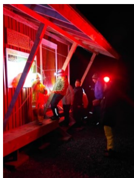
Skattjakt i Modalen

Under våren träffades Äventyrliga familjen vid 4 tillfällen och under hösten vid 3 tillfällen. Vi har bland annat vandrat, lekt, övat samarbete och paddlat. Vid ett tillfälle fixade gruppen hinderbanan vid Kaserna Hembygdsgård. Vi har varit på Hotellberget i Dingle och Hedums vatten i Bärfendal. Under året har sammanlagt 12 familjer deltagit med barn i varierande åldrar.