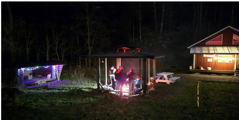
Kvällsmys på Modalen

Fler hittar och efterfrågar stugan. Numera så går åter Bohusleden förbi stugan och vindskyddet. "Röjgubbarna" förser stugan med ved och sköter omgivningen med bravur!