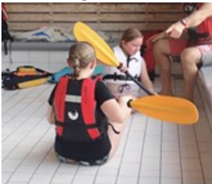
Bassängsträning för de yngre, Tummlaren