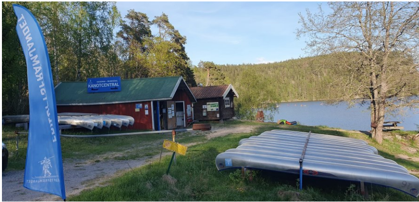
Kanotcentralen våren 2024 med ny skylt på taket.