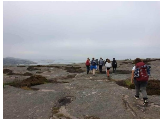
Vandring på Ramsvik