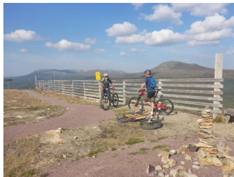
MTB på Idrefjäll