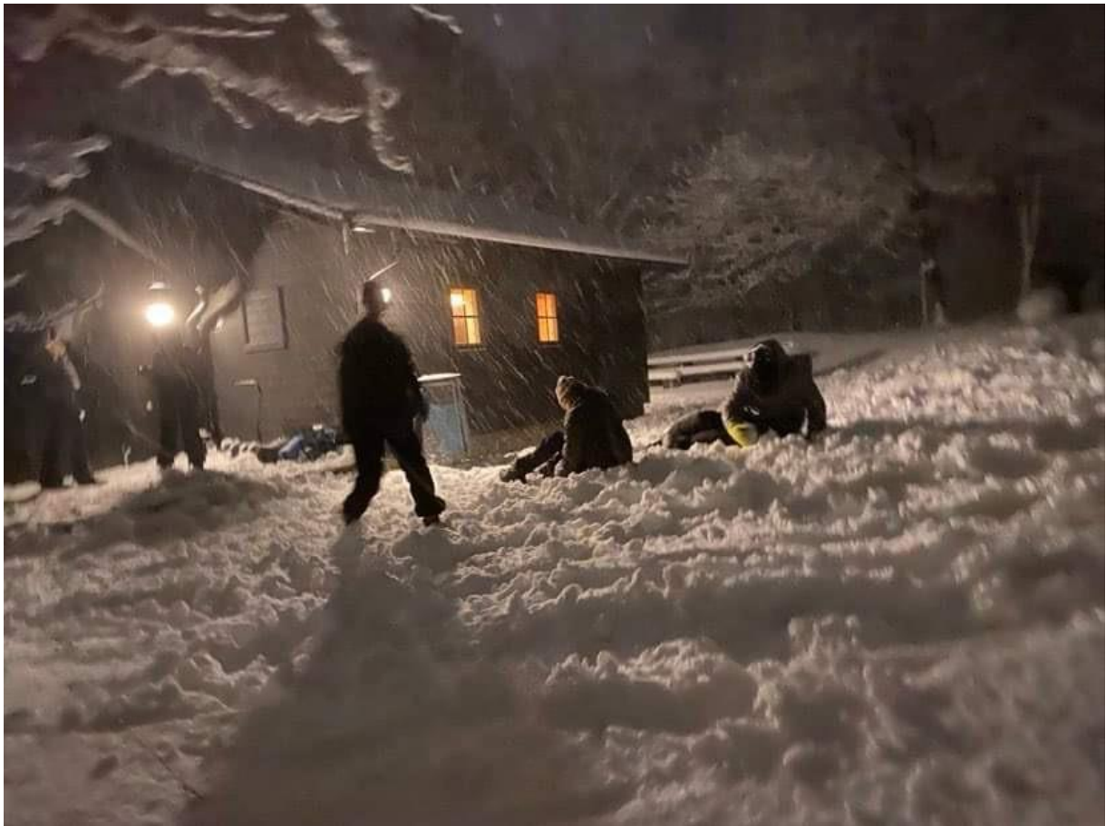
Lek i snön utanför Stockstugan med lufsargruppen De ylande fjällrävarna