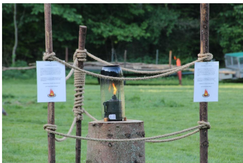
Camp Eld elden