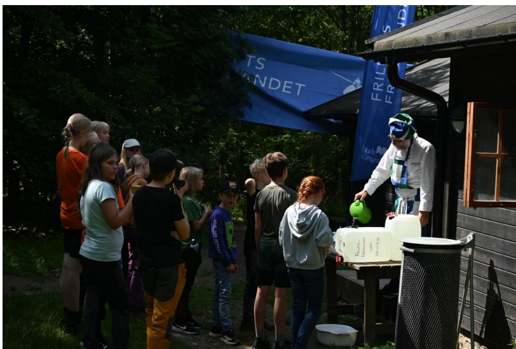
Barnen på sommarlägret väntar på fika