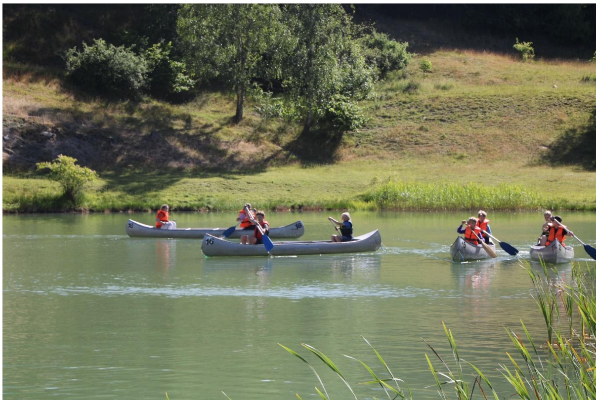
Paddling i Skryllesjön på sommarlägret.

Slutligen tog vi ett stort kliv in i framtiden i december när vi kopplade på SportAdmin på Lunds kommuns IT-system för bokning av halltider och ansökningar om bidrag; Rbok