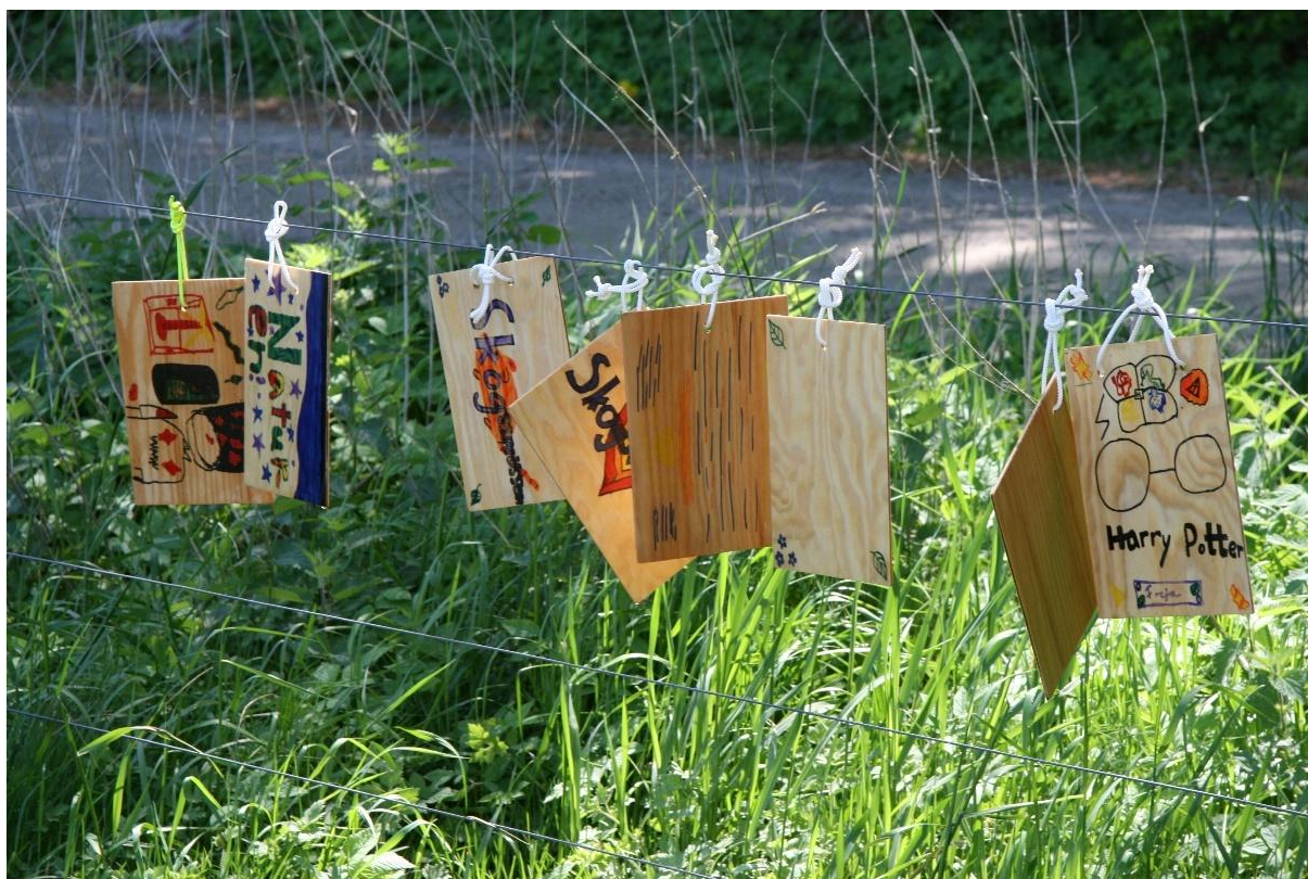
Nygjorda hajkbrickor på Camp Eld