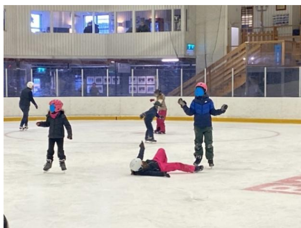
Helgaktivitet på isen.

Viktiga lärdomar som kommit ut av piloten är att det finns ett stort intresse för friluftsliv bland barn och unga men många känner inte sedan tidigare till Friluftsförbundet och vår verksamhet.