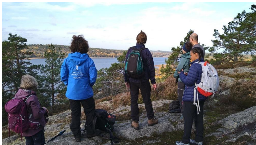
Utsikt från Brevikshalvön.

var väldigt uppskattade av deltagarna. Vårens gäng bestod av erfarna vandrare vilket gjorde att vi kunde hålla ett jämnt och högt tempo. Höstens vandring genomfördes i fantastiskt höstväder men trots färre deltagare var vi tvungna att hålla lägre fart på grund av halkig höstterräng. Vid båda tillfällena siktades havsörn.