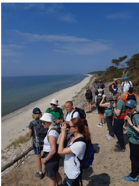
Utsikt västra sandön

Första dagen gick gruppen för att skåda sälar, direkt när vi kommit i land från båten. Det var en gynnsam dag och glada vandrare som fick se många sälar. Andra dagen var den längsta vandringsdagen, då vi gick tvärs genom öns tallklädda moar mot sydvästra delen av ön, där gammal bebyggelse finns kvar. Vi hade tur att en kunnig person från Länsstyrelsen hade en guidning och berättade om öns historia. Vi njöt sedan av fantastiska vyer när vi gick på de höga sandåsarna längs västra stranden söderut.