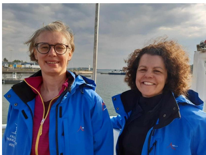
Förväntansfulla ledare på båten mot Gotska sandön

Vi gjorde många lärdomar inför och under resan. Bland annat hur reseförsäkringen med Kammarkollegiet fungerar, att det är bra att vara mer än två ledare som ansvarar då det kan bli sårbart om den ene blir okry, hur vi ska planera säkerhetsmässigt då det var ojämn telefontäckning – vi hyrde en GPS-telefon. Vi hade kontakt med Huddinge som gjort en sådan resa i aug 2023 och fick lite inspiration. Bland annat tipsade de om att ha ett förmöte, för att ge information och lära känna varandra lite. Vi hade ett sådant digitalt i april.