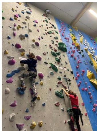
Testa på klättring.