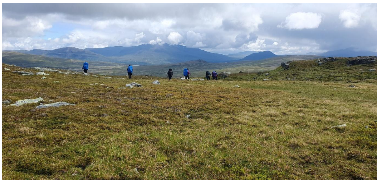
Bild från fjällvandring i Jämtlandsfjällen sommaren 2024.