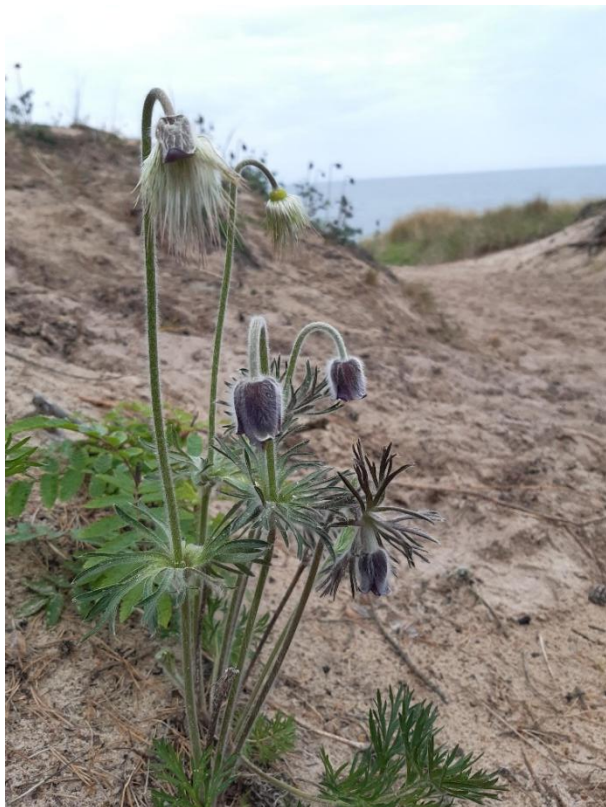
Fältsippor på Gotska sandön.

För våra vinteraktiviteter är det ju skridskoskolan som är vårt fokusområde. Under kalenderåret är det en vintertermin jan-mars och höst nov-dec. Dock blir det för grupperna och deltagarna mera höst – vinter. Flera deltagare är återkommande, men också en hel del nya. Två terminer med ca 5–8 träffar gav 240 aktivitetstimmar under 2024. Längdskidor för barn och vuxna tog lite paus detta år. Vi har dock möjlighet att delta på aktiviteter ordnade av närliggande lokalavdelningar. Vi har dock en stark önskan om att ha egen verksamhet för detta. Långfärdsskridskor har vi för tillfället inga aktiva egna ledare i Västerort, men samarbetet med Mälareörarna i Västerskrinnarna möjliggör tillgång till turer och Skridskonätet även för Västerorts medlemmar.