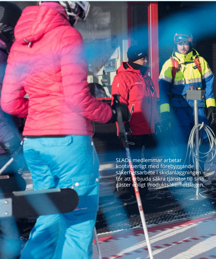
SLAOs medlemmar arbetar kontinuerligt med förebyggande säkerhetsarbete i skidanläggningen – för att erbjuda säkra tjänster till sina gäster enligt Produktsäkerhetslagen.