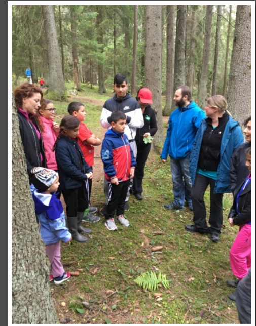
Tveta Mullespåret & Familjedag 18 september