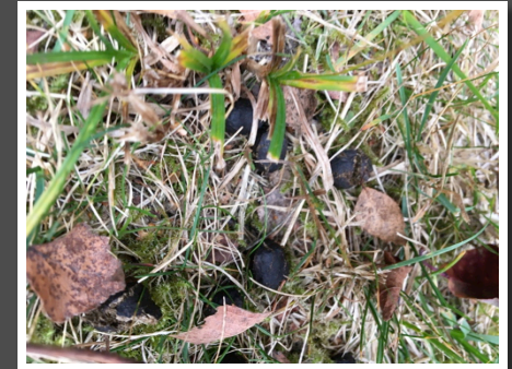
Öbacken-Bränninge naturreservat vandring 15 oktober