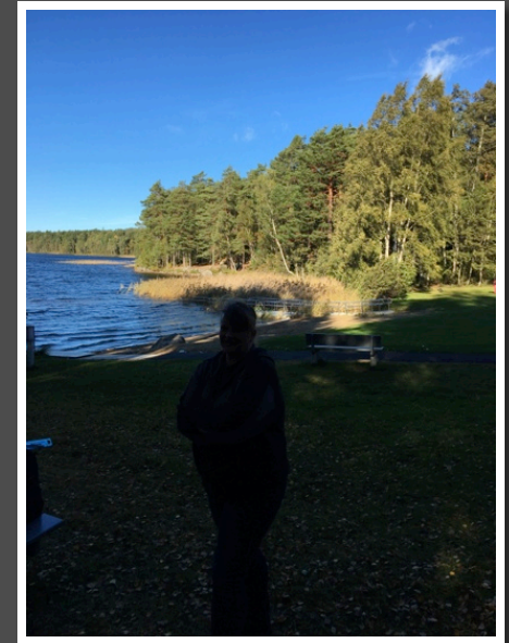
Gillberga matlagning 1 oktober