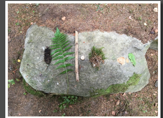
Tveta Mullespåret & Familjedag 18 september