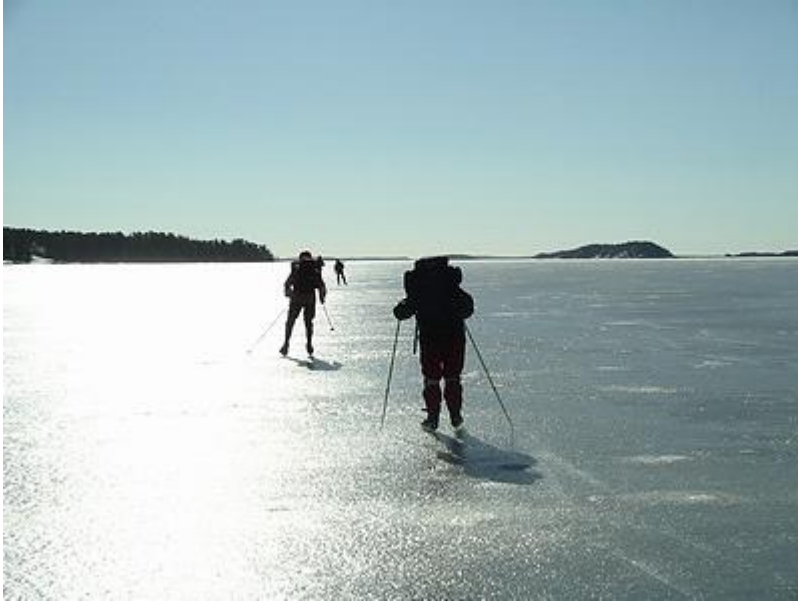
Mot solen och lunchen (27/3)