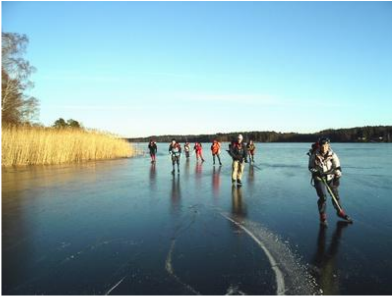
Vallentunasjöns fina is (12/12)