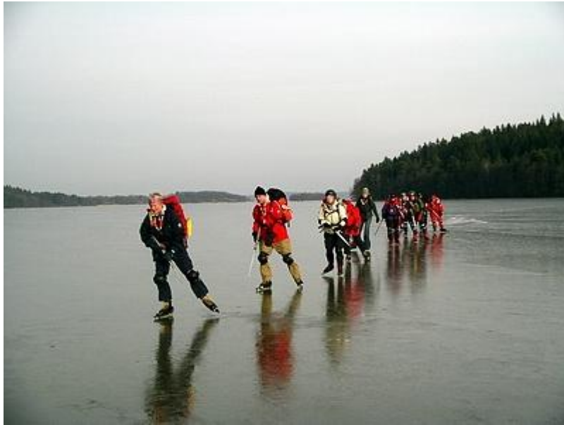
Arnö huvud passeras (6/2)