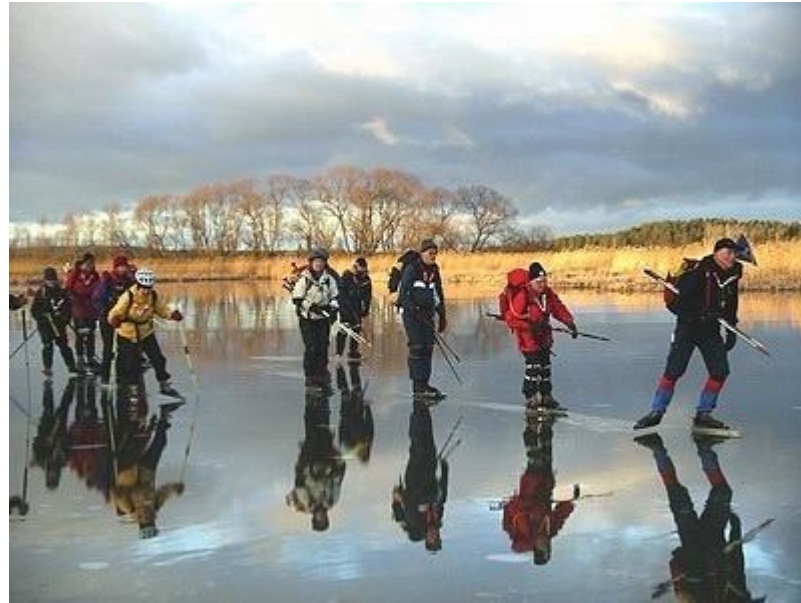
Pröva-på på Garnsviken (6/1)