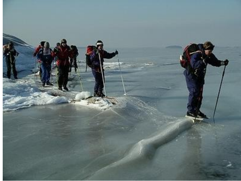
Åkning i upp- och nerförsbacke (6/3)