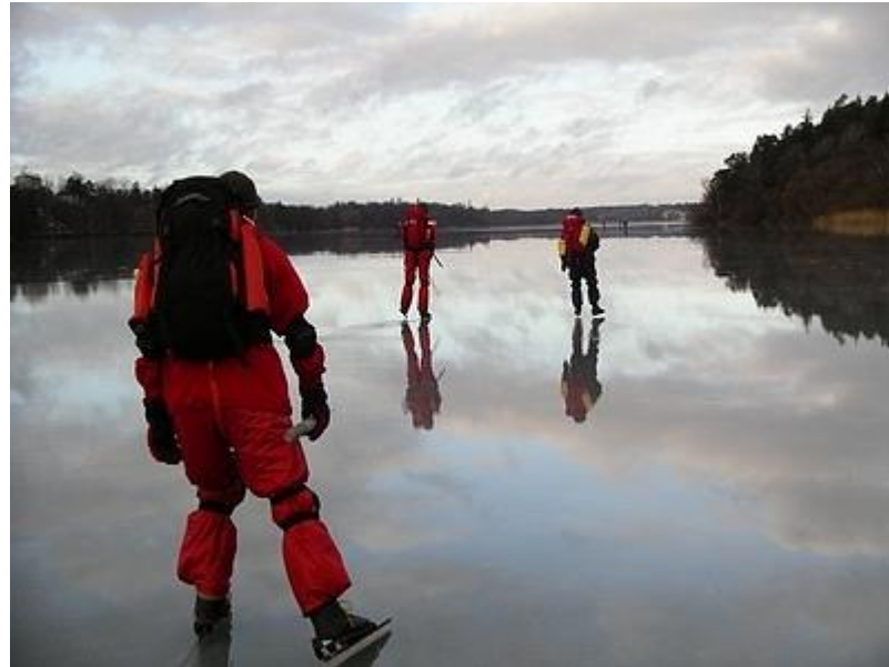
Härlig medvind på Norrviken (2/1)