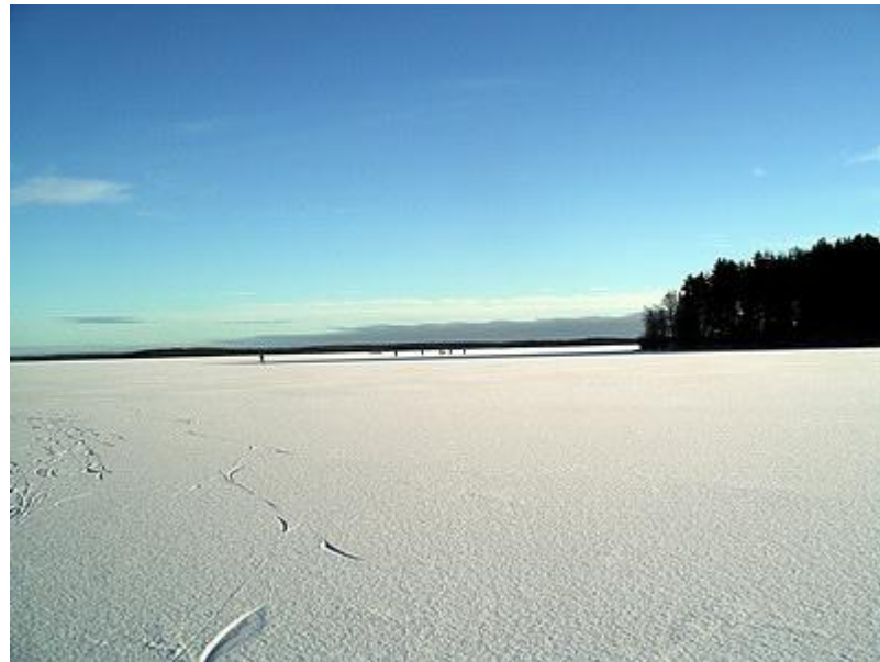
Ut mot Körnicka (den stora fjärden på östra delen av Storsjön) (23/1)