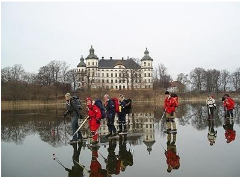
Skokloster passeras på vattentäckt is (6/2)