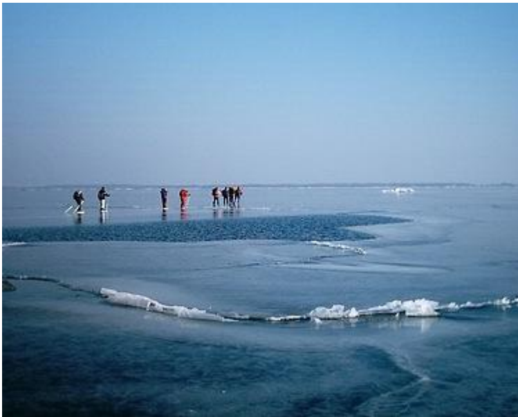
Vindbrunn mot Vidinge (6/3)