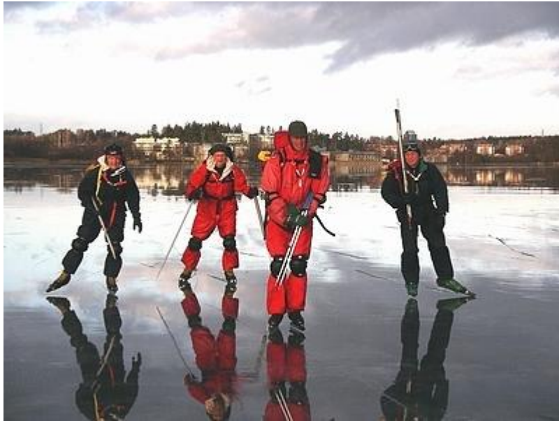
Motvind mot målet (2/1)