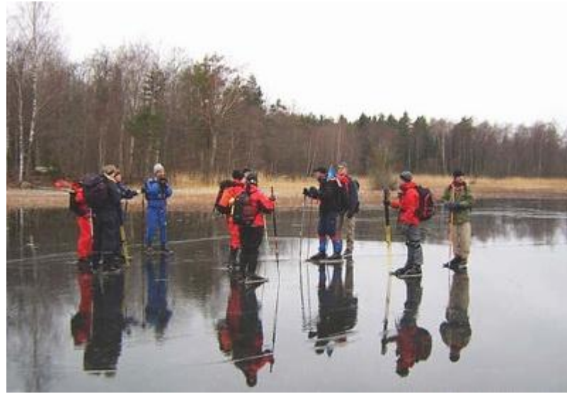
Vällens fantastiska is (16/1)