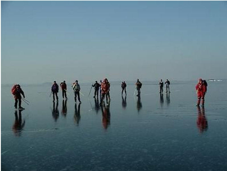
Utspridda vid rast på Ådskärsfjärden, lite svagare (6/3)