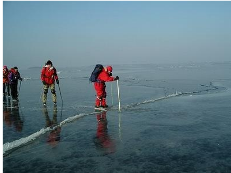
Liten råk och vindbrunn på Kudoxafjärden (6/3)