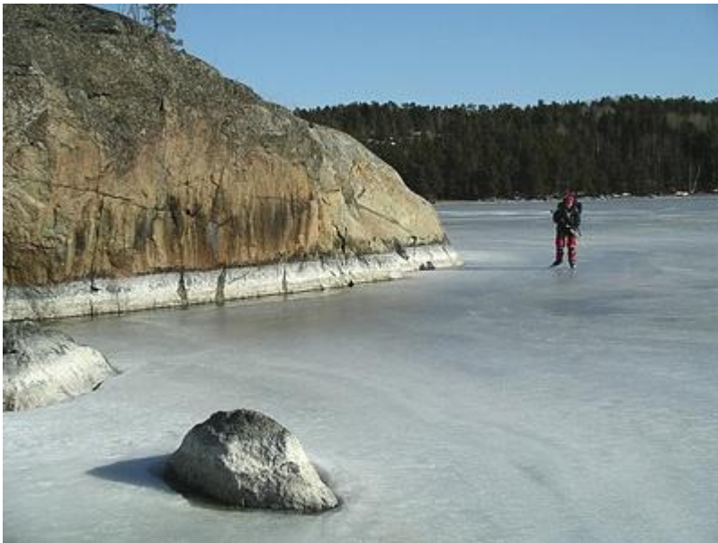
Längs fina klippor (27/3)