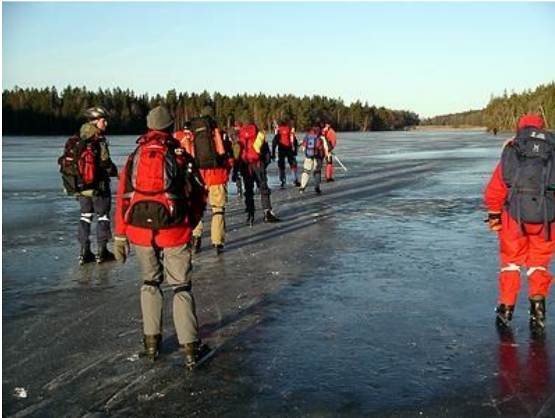
Solskensdag på Trehörningen och Ramsen (31/12)