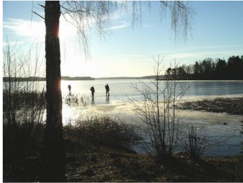
In mot rast i sol och värme (12/12)