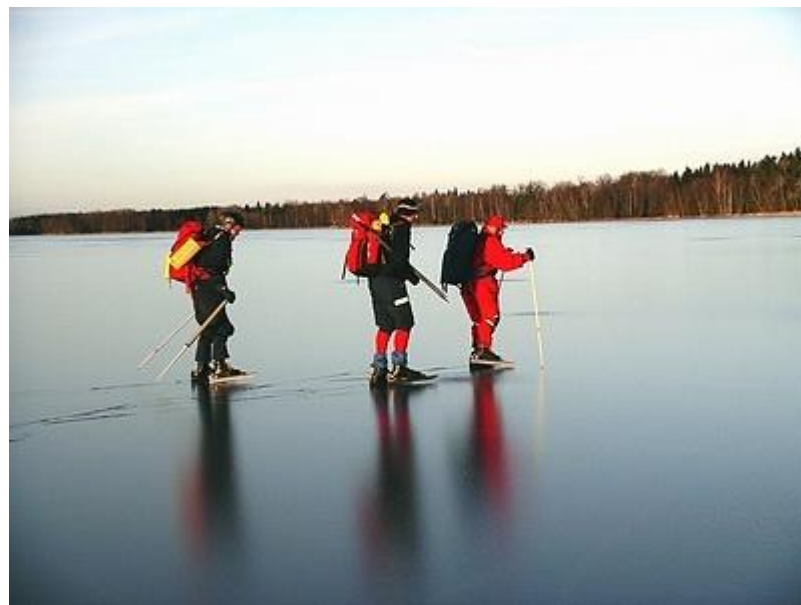
Vällens fina is, överis börjar bildas (9/1)