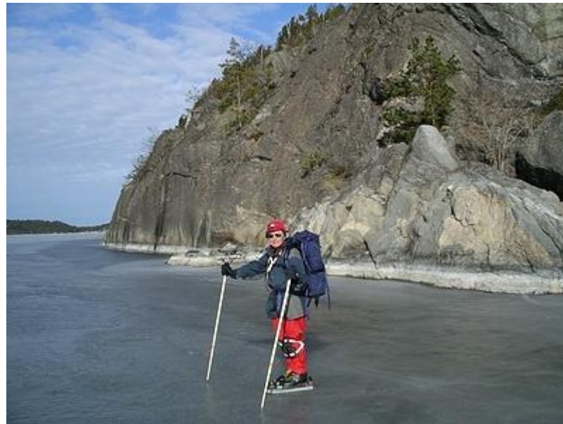
Ingarös höga klippor (27/3)