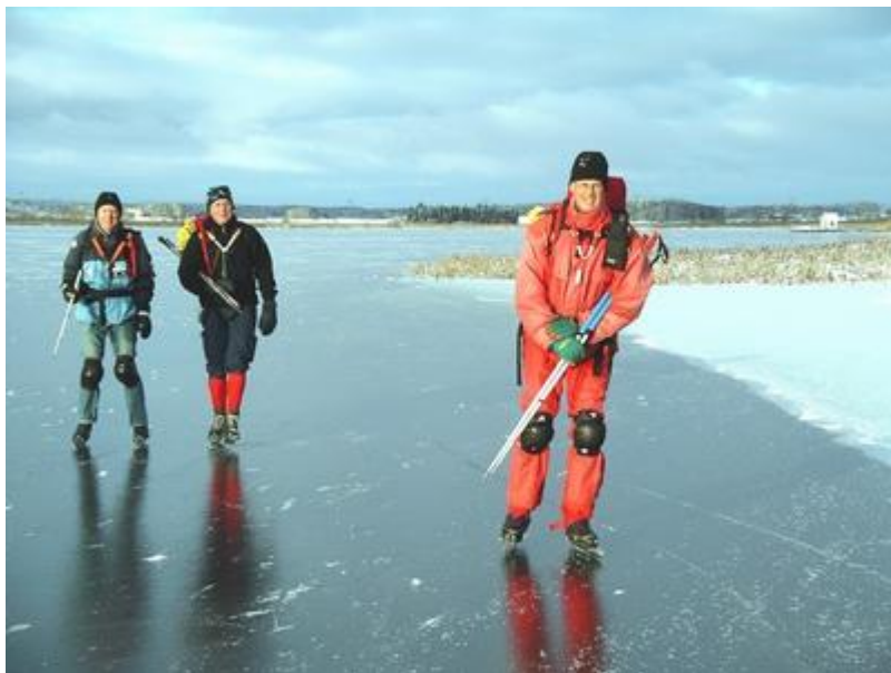
Ystra ledare på Garnsviken (21/11)

Nedan lite bilder, för att ge en uppfattning om hur det är på våra turer.