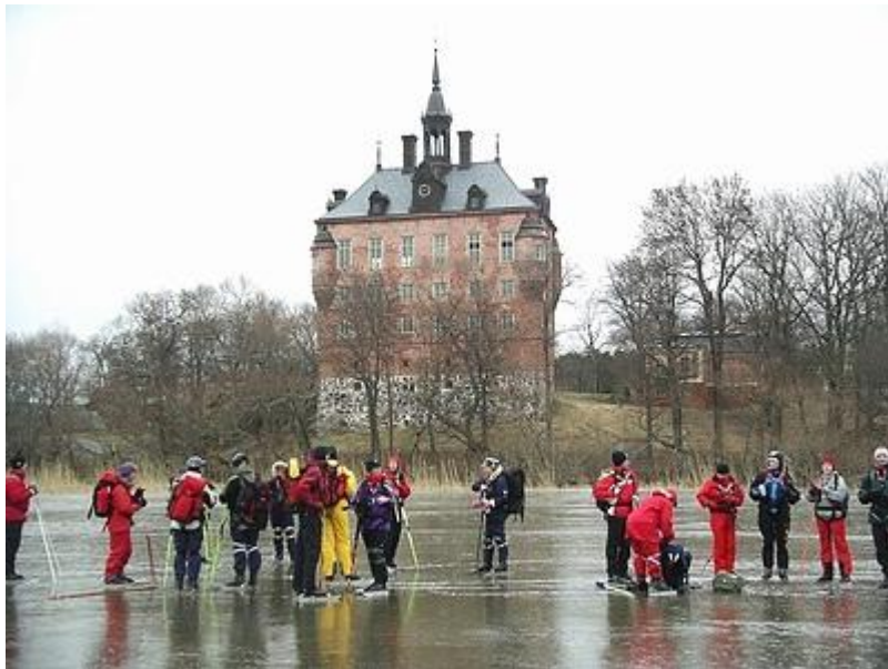
Wiks slott (12/2)