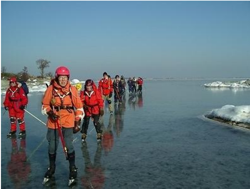
Fina passager utanför Sundskär (6/3)