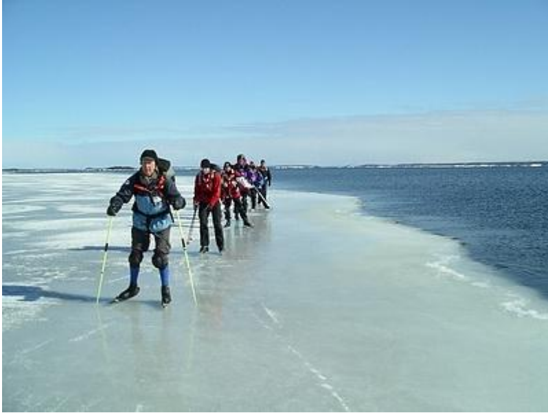
Åkning längs hård iskant på fin is (20/3)