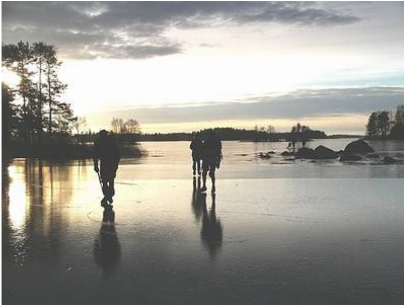
Bland Storsjöns alla öar (15/1)