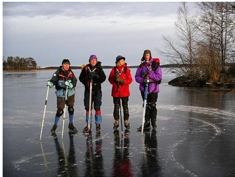
Gruppen på Storsjöns fina is (15/1)