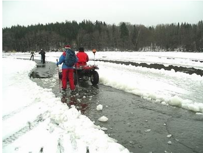
Plogning av ny "kanal" (19/2)