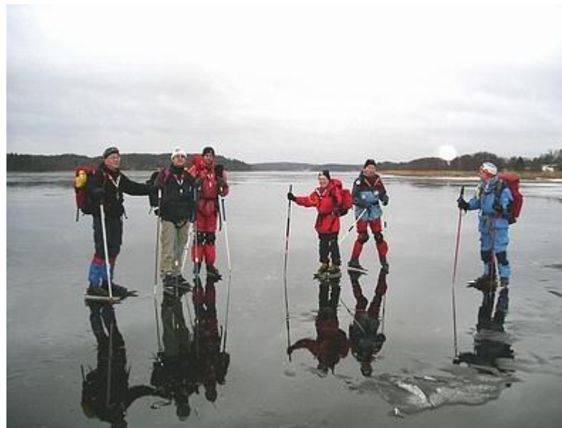
På Garnsviken lätt vattentäckta is (5/12)