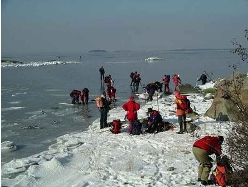
Fikarast på Kudoxa (6/3)