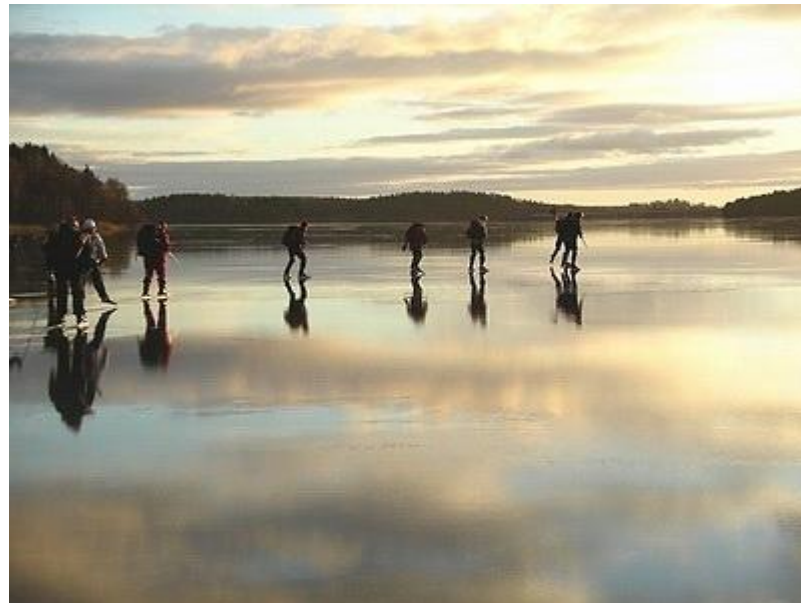
Trolskt ljus när vi svävar fram på Garnsviken (6/1)