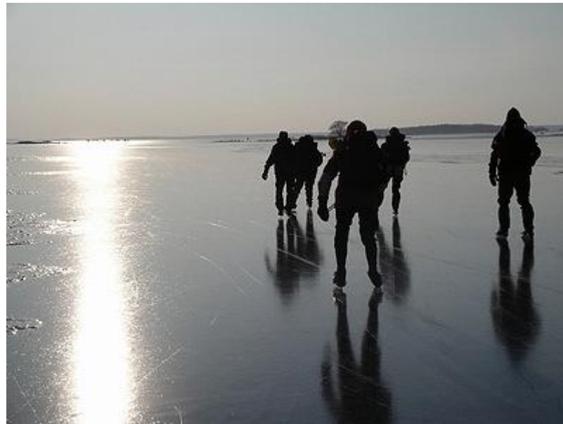
Medvind och sol i ansiktet mot Bromskär (6/3)