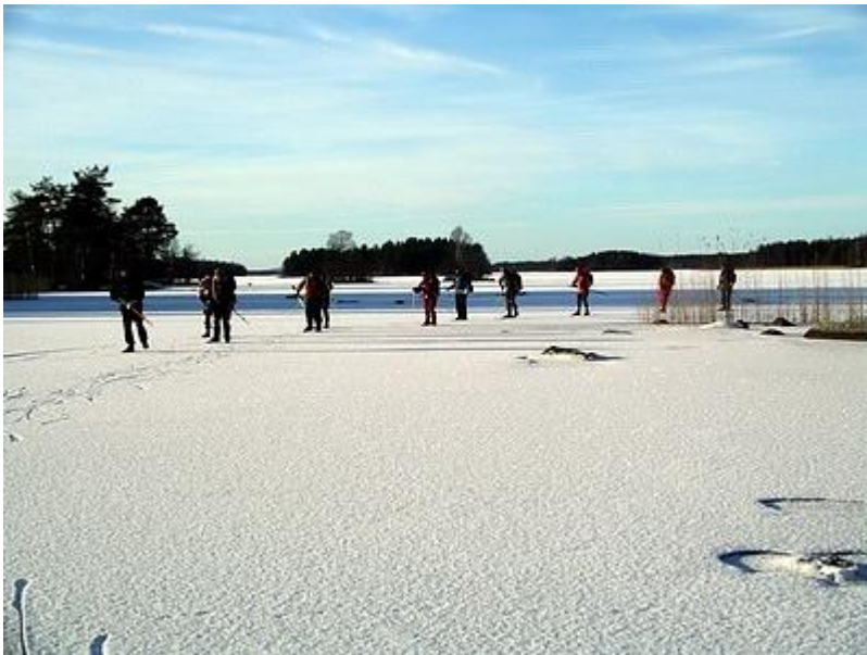
Många öar, vackert vinterlandskap (23/1)