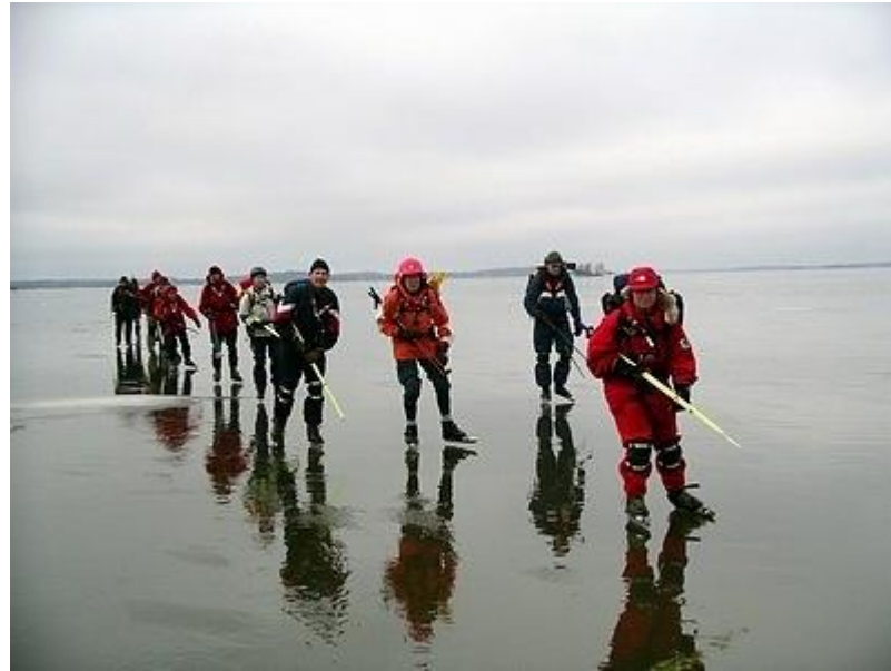
Medvindssträcka på Blackens stora ytor (30/1)