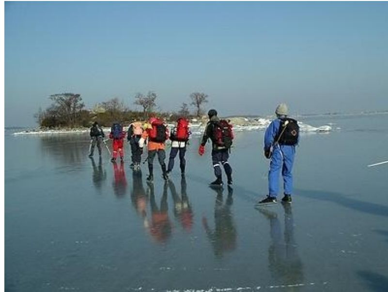
Den perfekta isen (6/3)