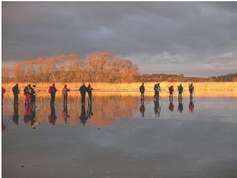
Norra änden av Garnsviken (6/1)