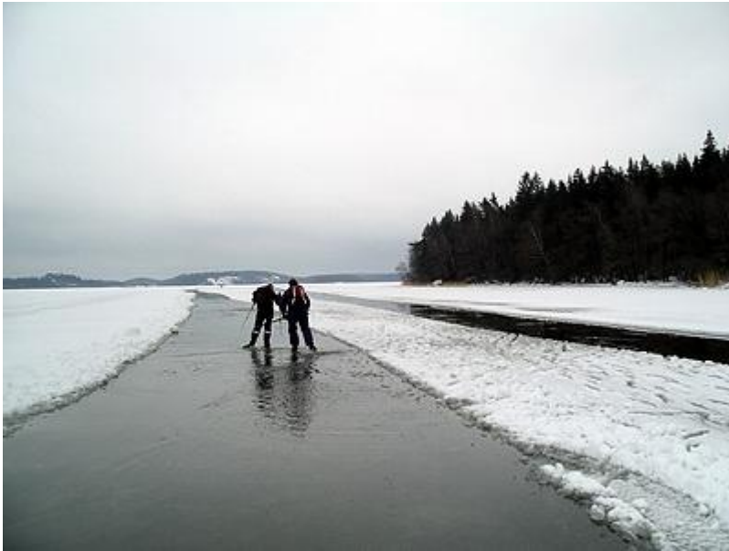
Deltagare på väg mot Kairo (19/2)