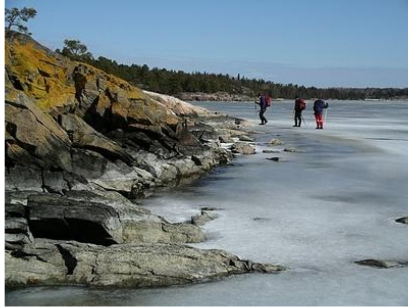
Upp på klipporna för lunch (27/3)