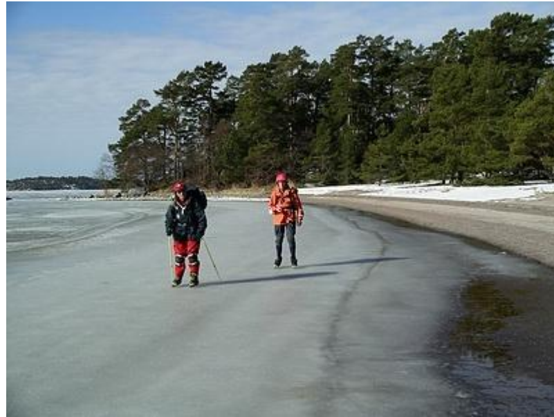
Längs badstränderna vid Ingarö (27/3)