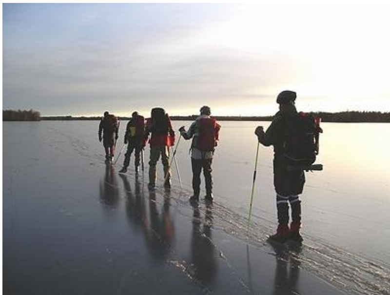
Ledaren bryter sönder överisen (9/1)