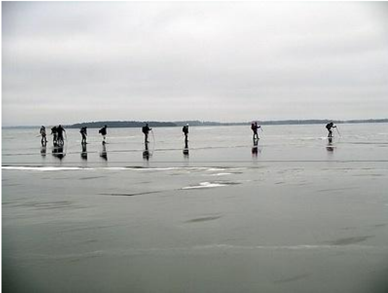
Snabbare gruppen möter för svag nysis på Blacken (30/1)