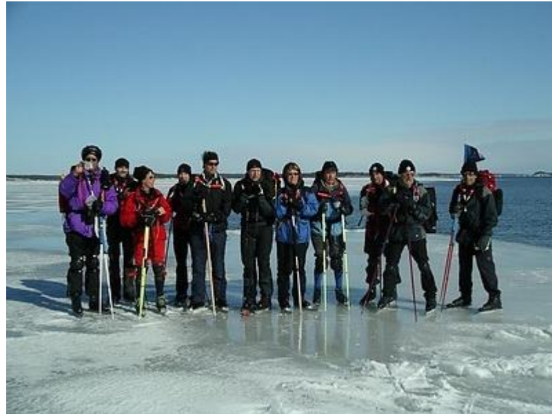
Gruppen vid iskanten norr om Stora Husarn (20/3)