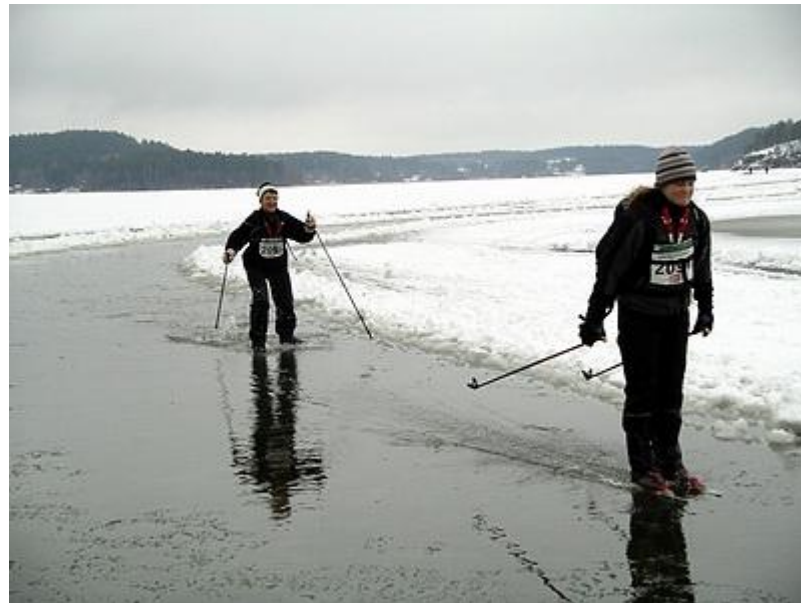
Vikingsrännets allt blötare bana (19/2)