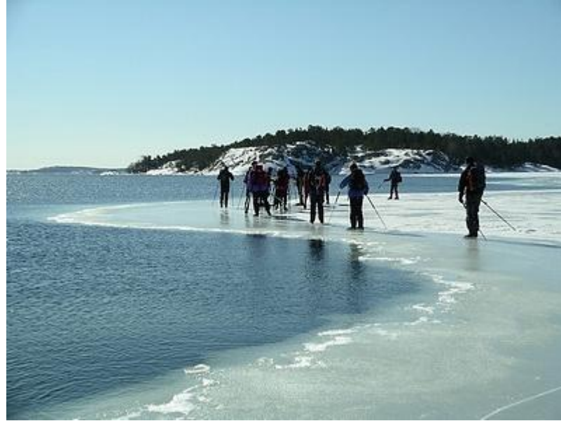
Vindlande iskant, Stora Husarn (20/3)