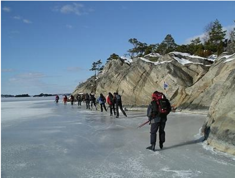
Fin is längs strandkallarna, dåligt utanför (20/3)