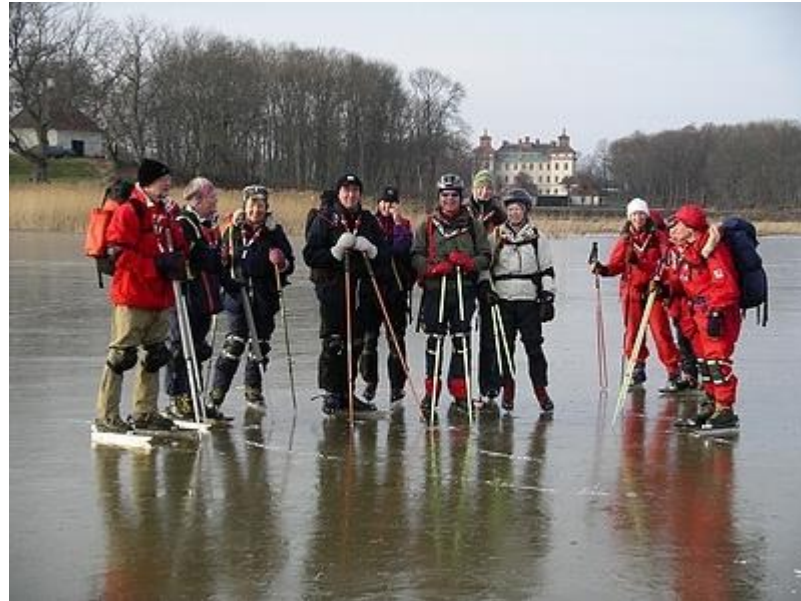
Rast vid Sjö slott (6/2)