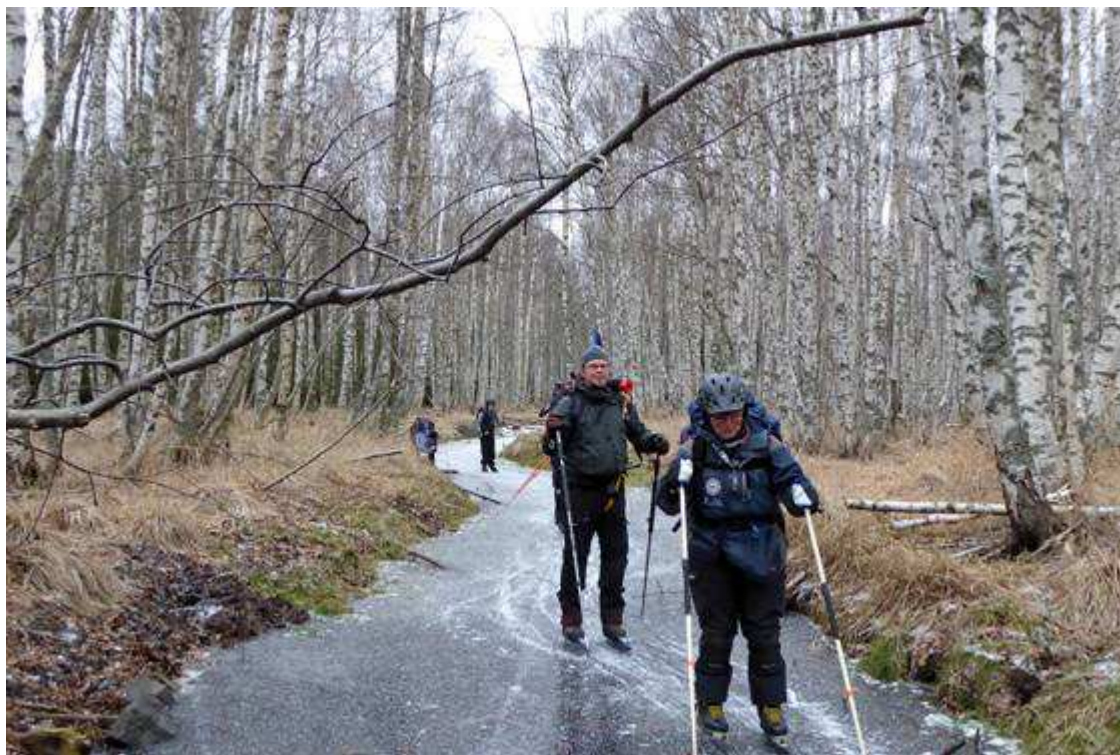
Florans myrmarker. Det går bra att åka skridskor på myren.