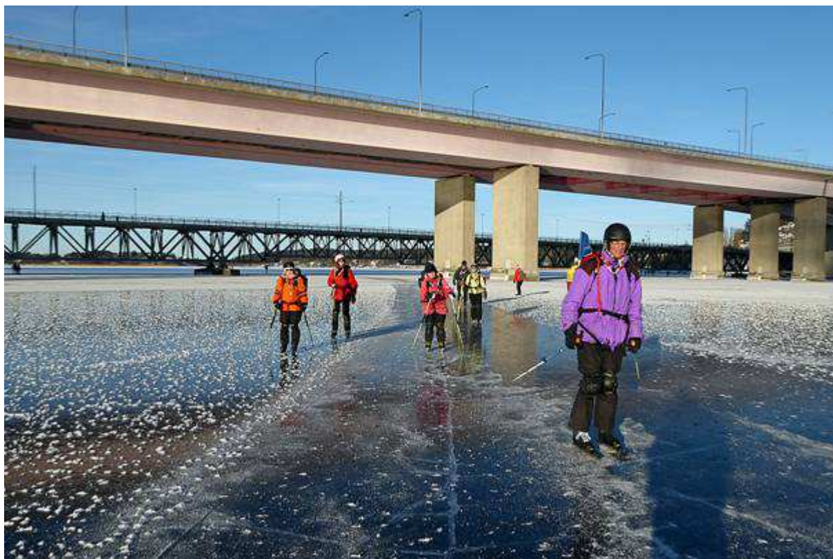
Under Lidingöbroarna på nyis! (inte en plogad bana utan en svävare som kört)

Skridskosäsongen börjar nu närma sig slutet. Vi hade dock tur både lördag och söndag 19-20 mars. Vi besökte olika delar av Mälaren, vid Biskops Arnö och söder om Sigtuna.