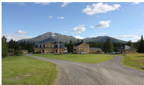
Avslutningen Enaforsholm Fjällgård med Snasahögarna och Blåhammaren i bakgrunden