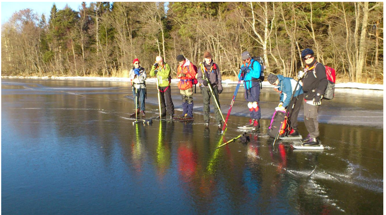
Glansis väster om Adelsön