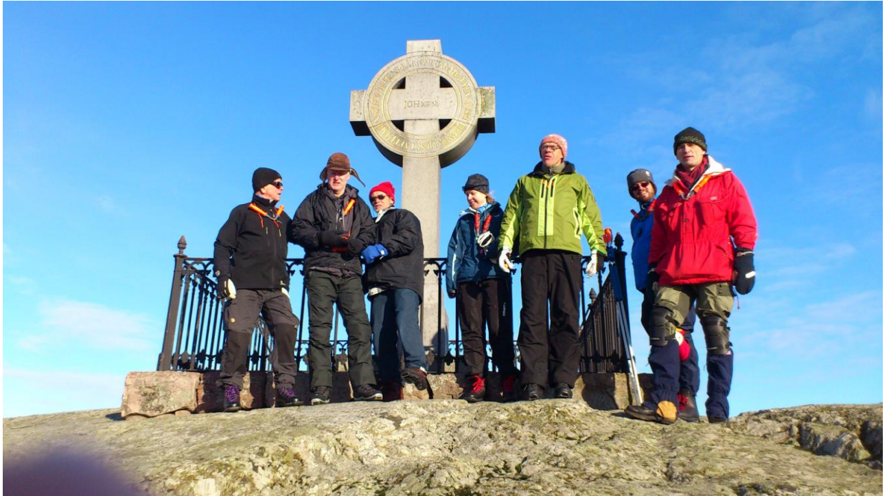
Toppbestigning på Björkö, Ansgarkorset