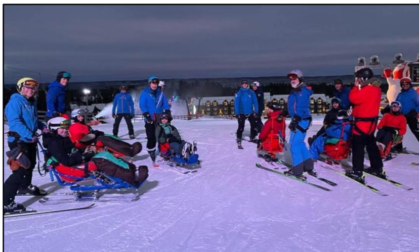
Utbildning Allmänmedåkare Biski

Vi utforskar möjligheten att kunna erbjuda skidskoleverksamhet för barn som kommunicerar på teckenspråk. En viktig del i att kunna utveckla den verksamheten är att vi behöver fler ledare som behärskar teckenspråk. Därför har en introduktionsutbildning-alpint för personer som kan teckenspråk utvecklats och genomförts i Åre i december, med subvention av deltagaravgiften. Totalt har 8 nya hjälpledare i alpint, som använder teckenspråk, utbildats.