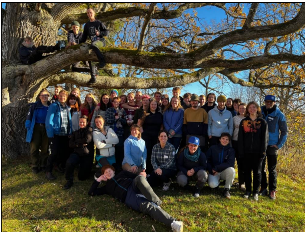
Deltagare och ledare på Ungdomsforum

“Det var en superrolig helg där jag lärde mig mycket om ledarskap och allmänt friluftsliv. Jag tyckte att upplägget var bra med mycket diskussion om ledarskap och hur man kan förbättras.” (Ung deltagare)