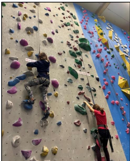
Friluftsfritids i Västerort

Piloten i Västerort har bland annat lärt oss att krav på föransökan kan vara ett hinder samt att en ledare med förankring och kännedom i orten kan överbrygga hinder.