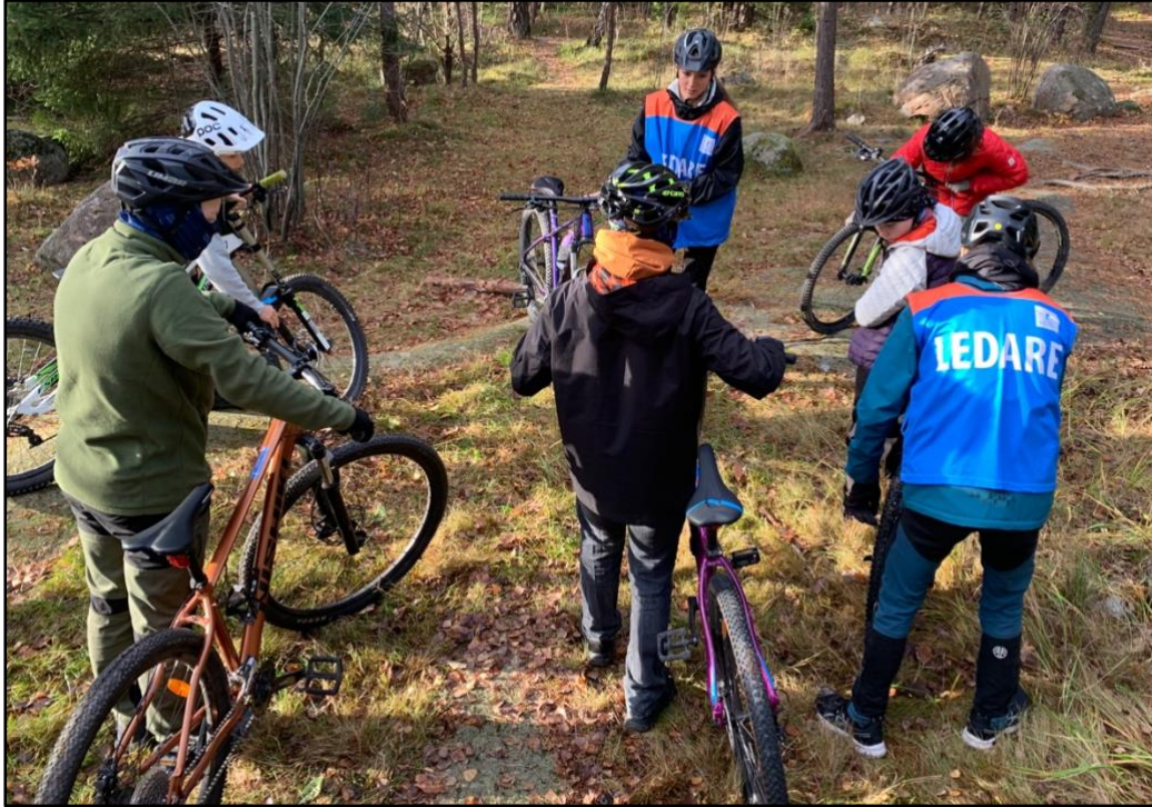
Introkurs i Friluftsliv för unga