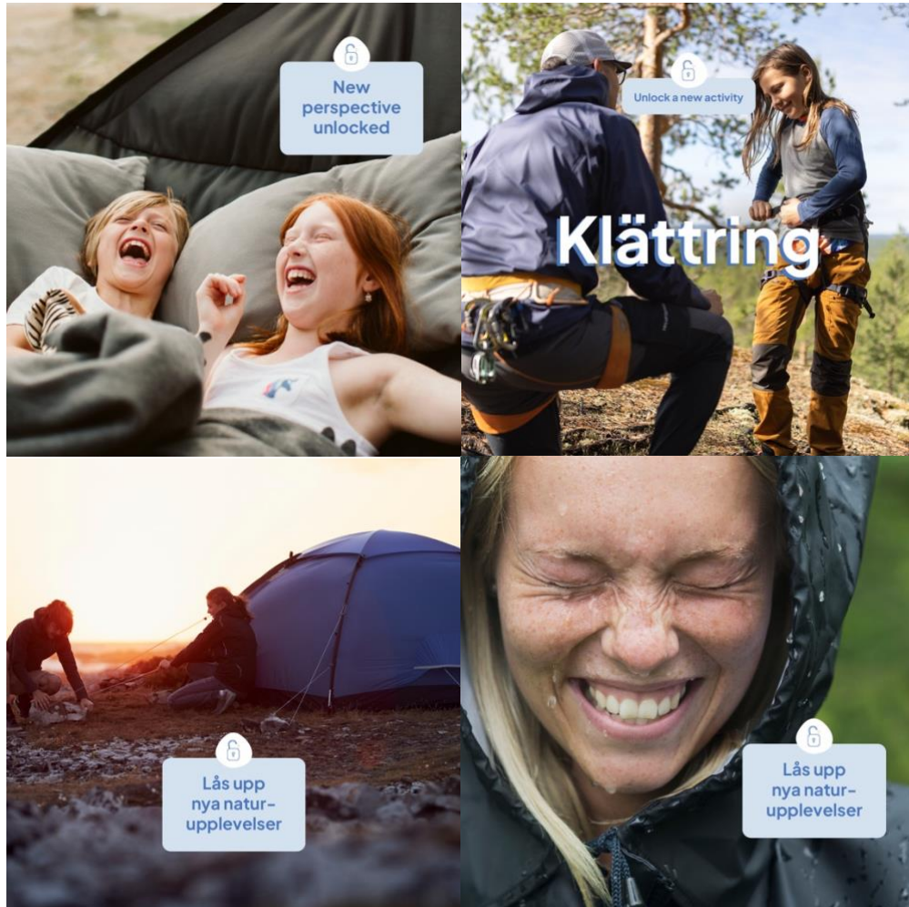
Exempel på SoMe-mallar

Vi har även genomfört en utredning av Friluftsliv Framjandets interna IT-behov. Arbetet har tagit hänsyn till och vidareutvecklats med input från Svenskt Friluftslivs undersökning av IT-behov.