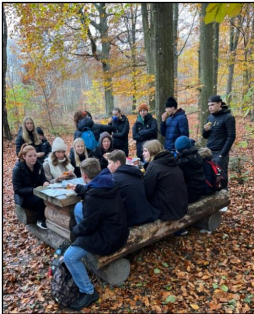
Ung ledarutbildning Snyggatorpsskolan

Region Syd genomförde under två dagar i november en ledarutbildning för 20 elever i åk 8 - 9 från Snyggatorpsskolan i Klippan, Skåne. Det är ovanligt att vi utbildar ungdomar som inte redan är medlemmar och därför en bra erfarenhet för organisationen. Utbildningen kom till efter dialog med klassens friluftsinresserade idrottslärare. Utbildningen innehöll moment kring friluftsteknik, metodik och ledarskap – det sistnämnda visade sig vara höjdpunkten för många av deltagarna. Reflektioner från lärarna var att gruppen förändrades och att eleverna fick nya roller vid miljöombytet då att nya personer som annars inte tog så stor plats nu klev fram, hade kloka inspel och reflektioner och deltog mer aktivt.