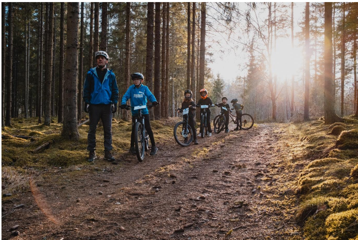
En grupp från MTB-skolan på en av de större stigarna i Borgen.