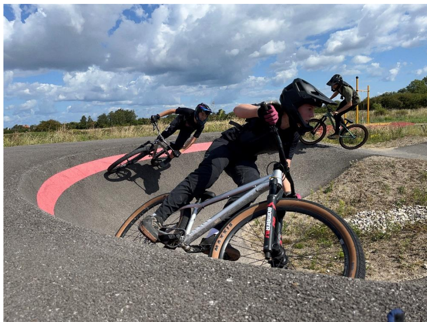
Några av våra ungdomar träna pumptrack i Köpenhamn