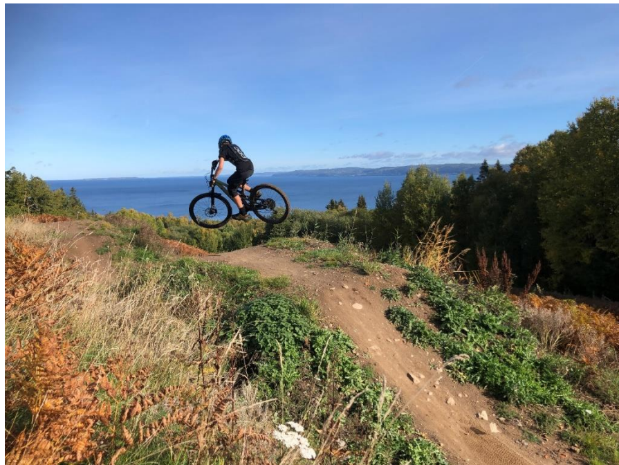
En av våra MTB-ungdomar på en utflykt till Nyarpsbacken i Bankeryd

Under året har flera medlemmar deltagit i olika event inom enduro, pumptrack och MTB-lopp i både Sverige och Danmark.