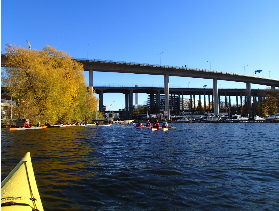
Tre broars möte: i förgrunden Johanneshovsbron, sedan nya Skanstullsbron och allra längst bort syns den öppningsbara gamla Skanstullsbron. Nedan: Kommunikationsmöten!