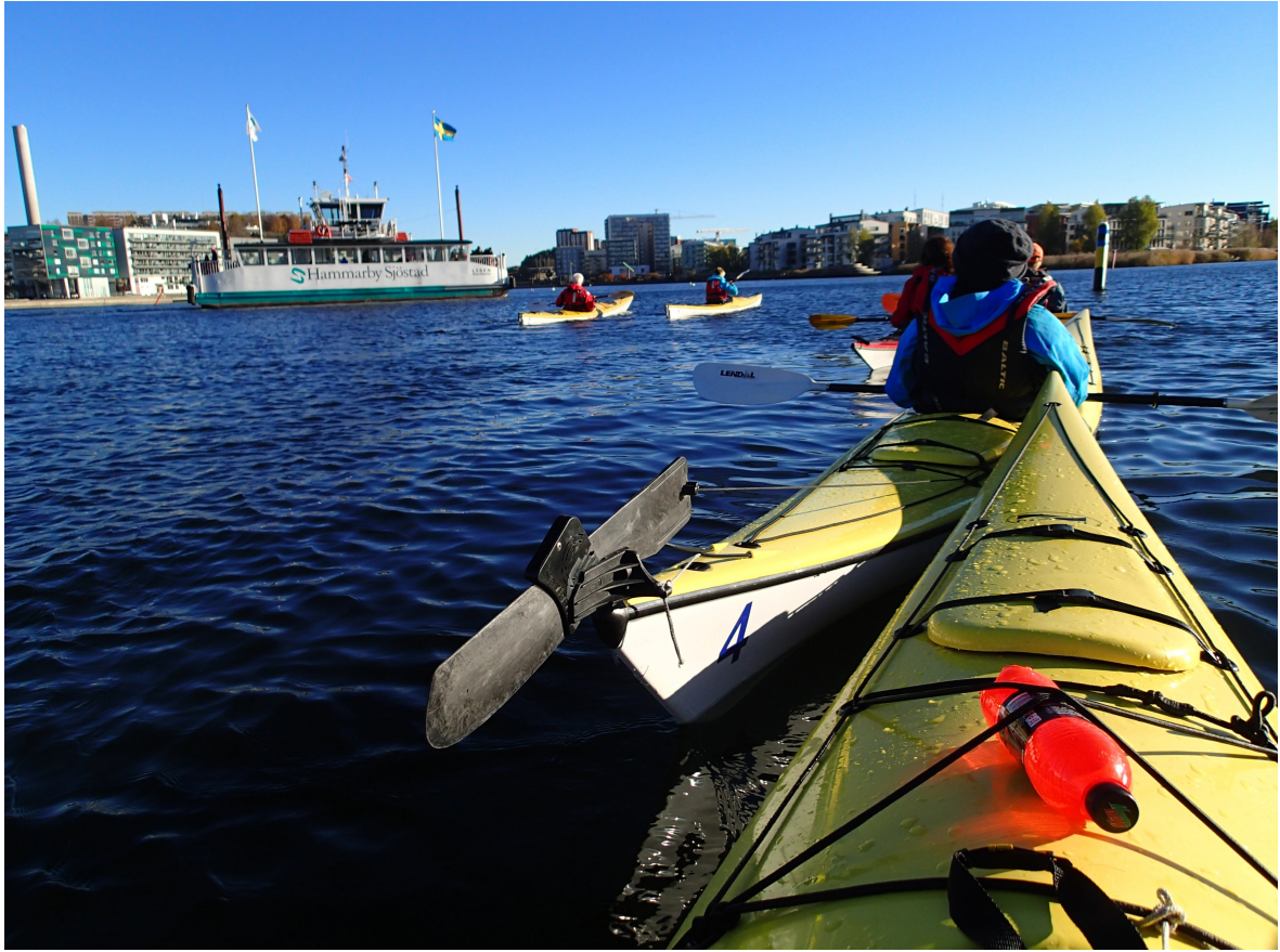
Hammarbysjöstad från sjösidan! Nedan: Lunch vid Sickla sluss.