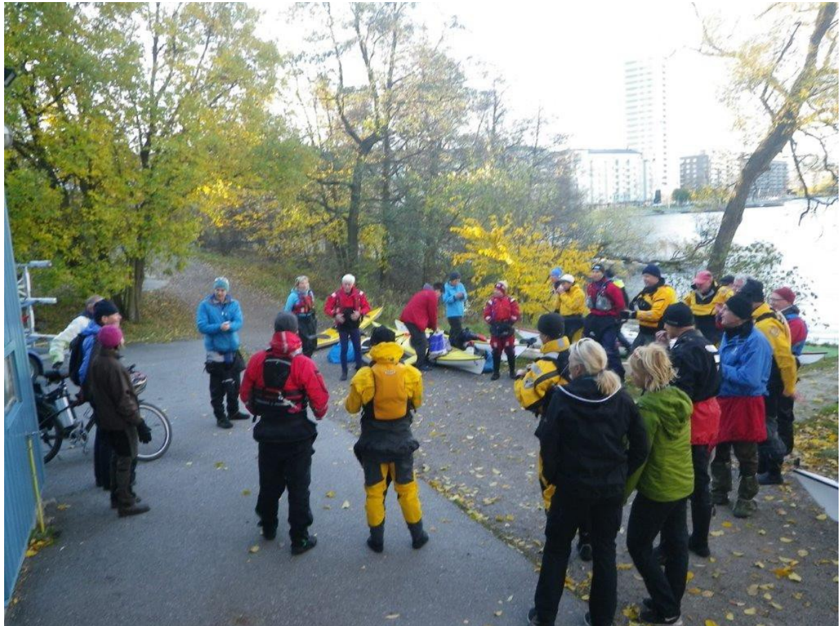
Samling på söndagsmorgonen vid Swima Kanotcenter. Nedan: Kajakerna stuvras för avfärd.