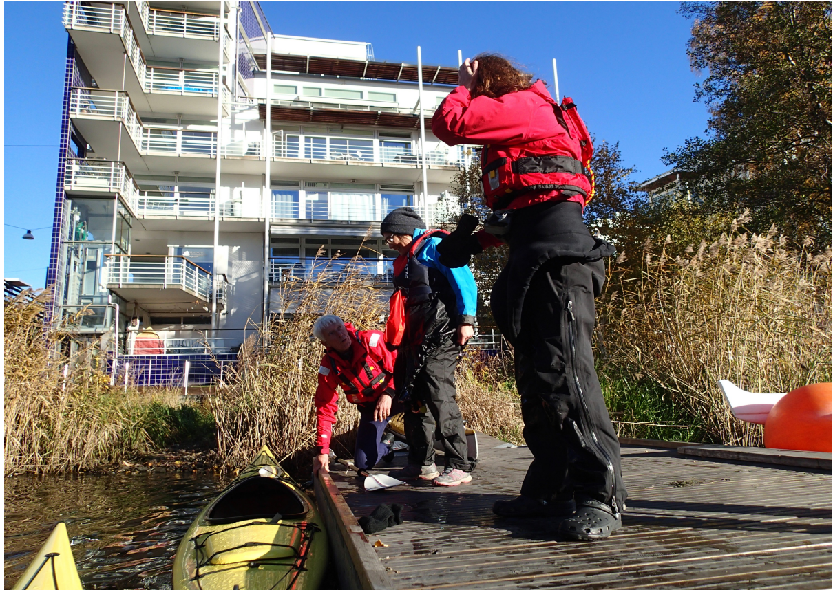
Kajakbrygga vid Sickla sluss. Nedan: Håll i tamparna! Hammarby sluss.