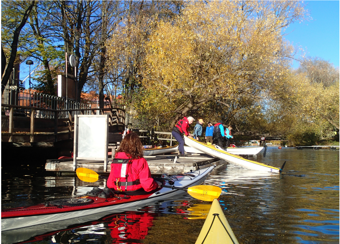
Reimersholme, jakten på toa börjar! Nedan: Här fanns hjälpen!