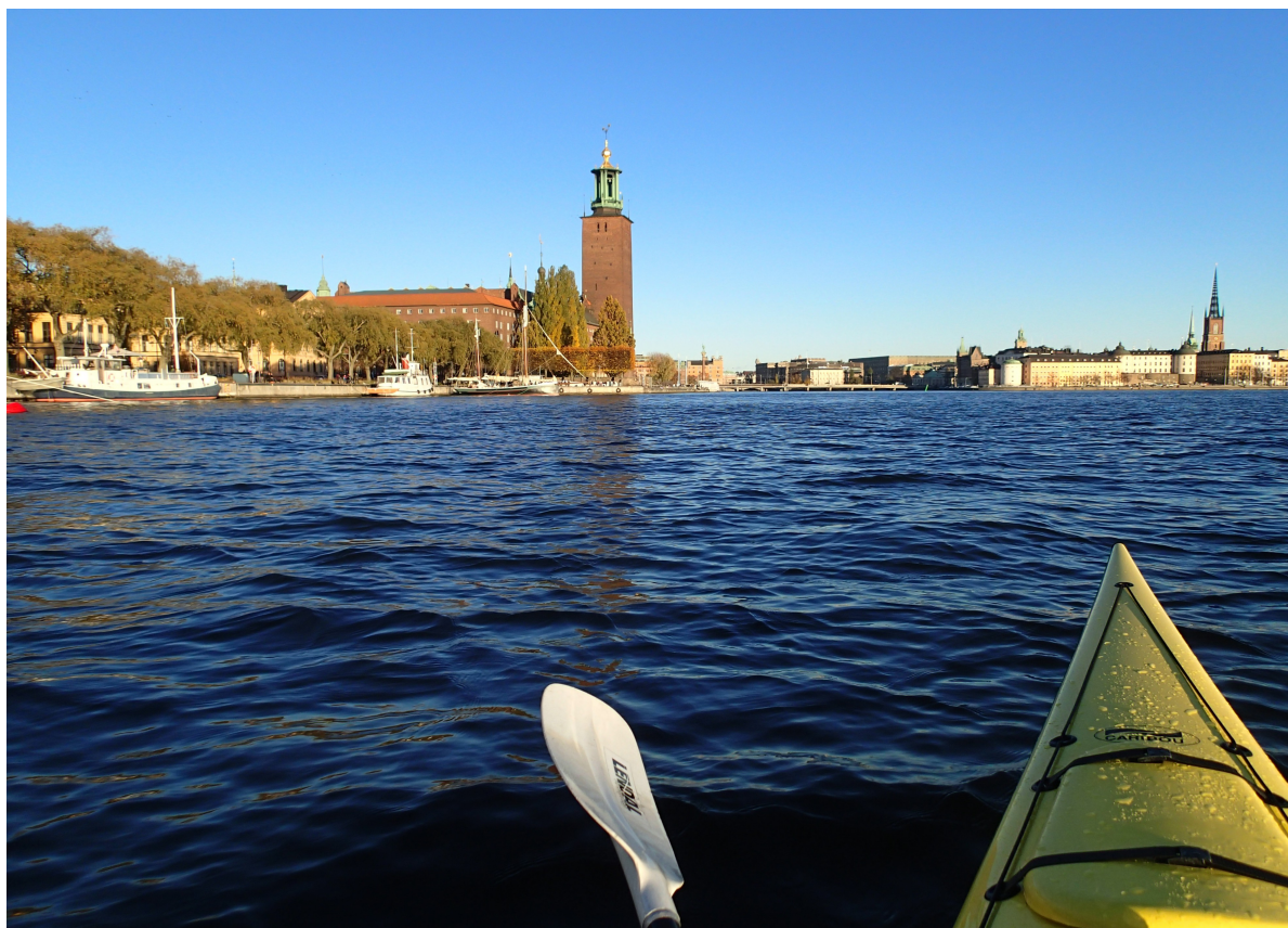
Närmast syns Stadshuset och längre bort finns Riddarholmskyrkan. Nedan: Paddlare genom nålsögat!