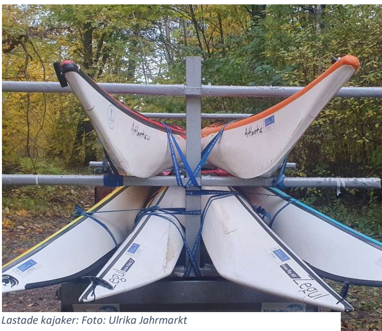
Lastade kajaker: Foto: Ulrika Jahrmarkt

Ett stort och varmt tack för år 2024 och 90 stora hurra till oss alla som engagerar oss i Friluftsförbundet Uppsala!