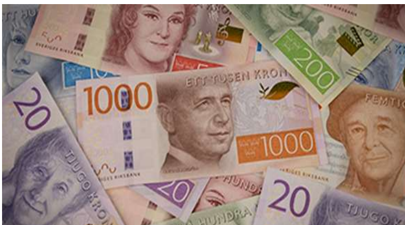
Nya sedlar: Astrid Lindgren, Birgit Nilsson, Dag Hammarskjöld, del av Ingmar Bergman, Evert Taube

Nettoomsättningen som kommer från våra verksamheter olika grenar har fallit ut lite olika. Alpin, lågland, skridsko har lyckats att överträffa sina mål på intäkter medans övriga har av olika skäl inte kommit upp till målen, vilket inte alls betyder att de har gått med förlust då även kostnaderna minskar i samma grad.