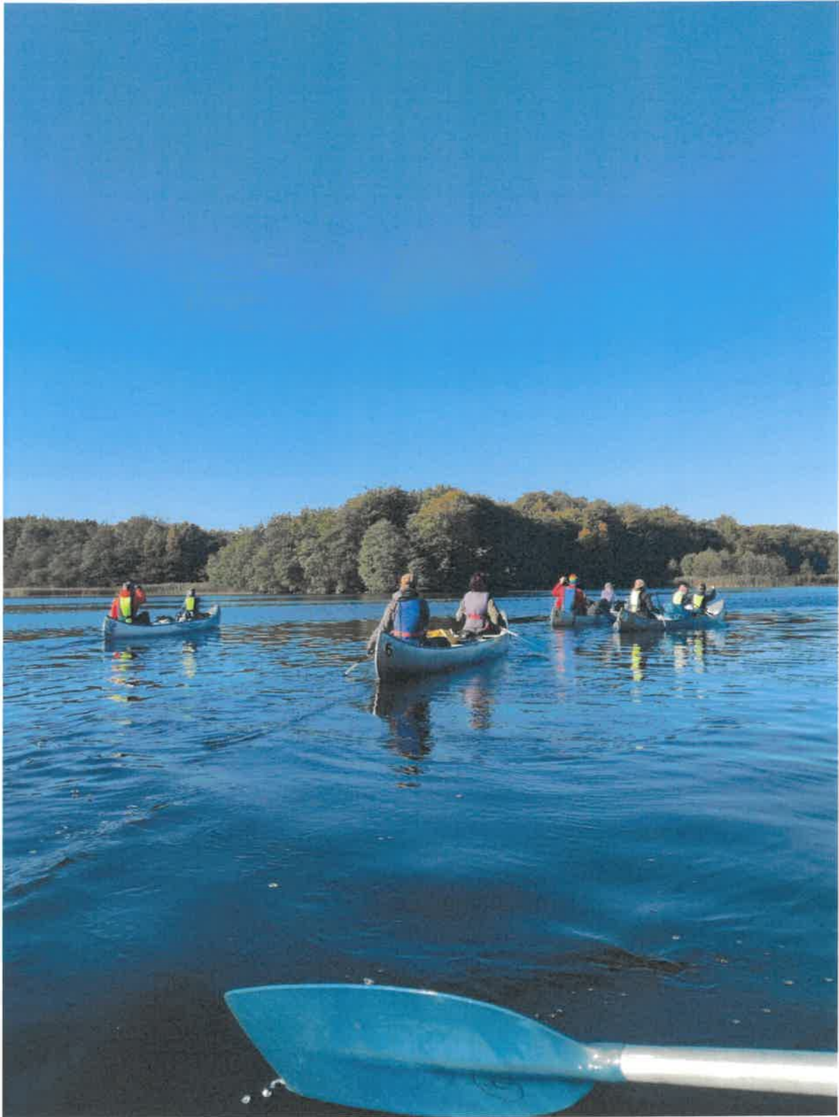
Paddling i höstfärger runt Häckebergasjön Fotograf någon av ledarna i lufsargruppen De ylande fjällrävarna.