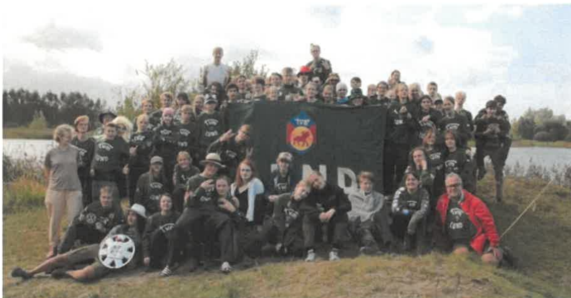
Många glada TVM:are på ting!