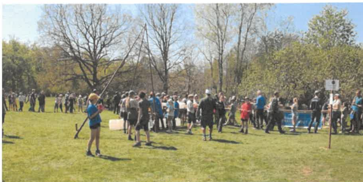
Lunch på Camp Eld