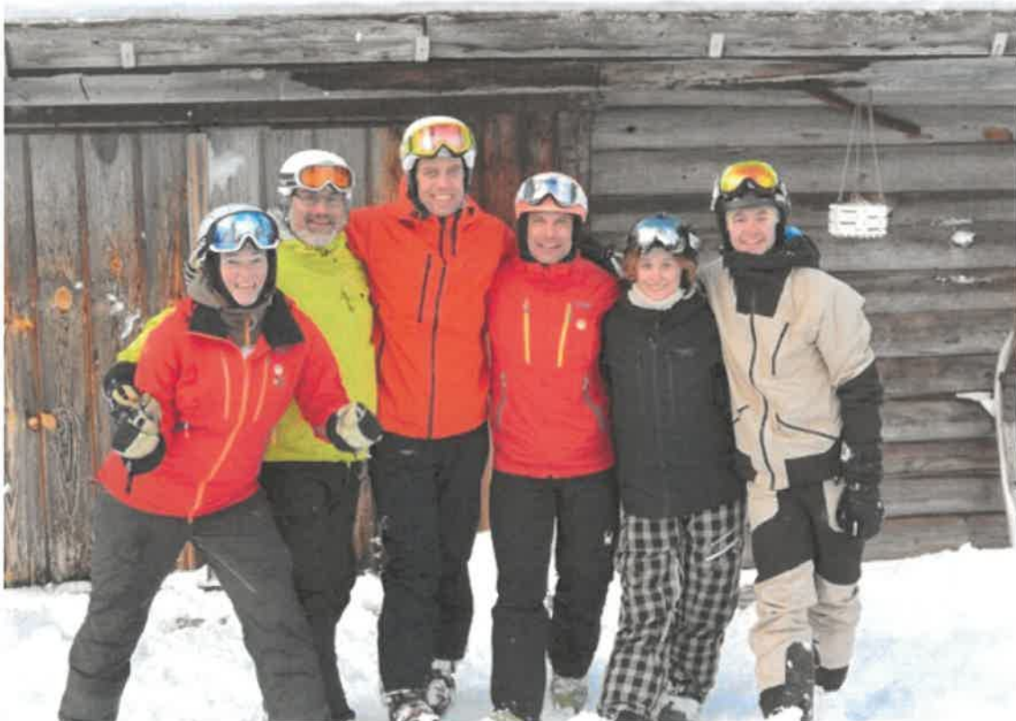
Idrelägrets ledare ser alltid till att solen skiner och att snön ligger djup i backarna.