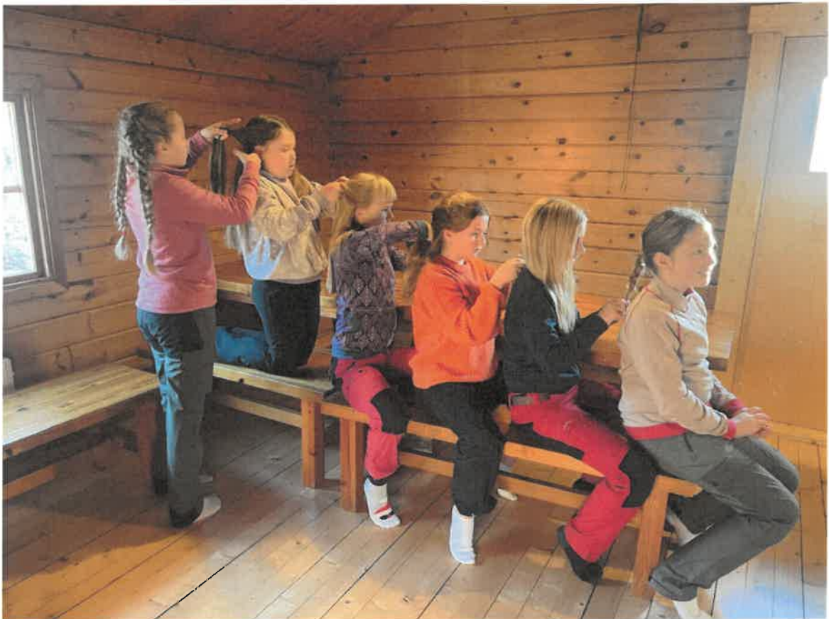
Stughäng i Stockstugan med lufsargruppen Skogens Honung