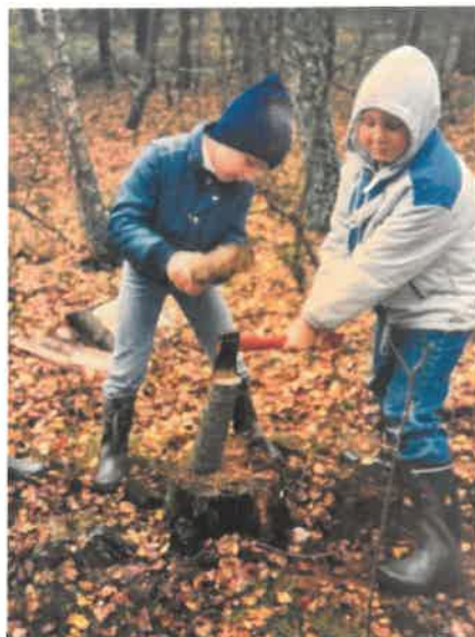
Året är 1987, jag och en kompis förbereder en eld som kommer skapa glädje och gemenskap i gruppen.