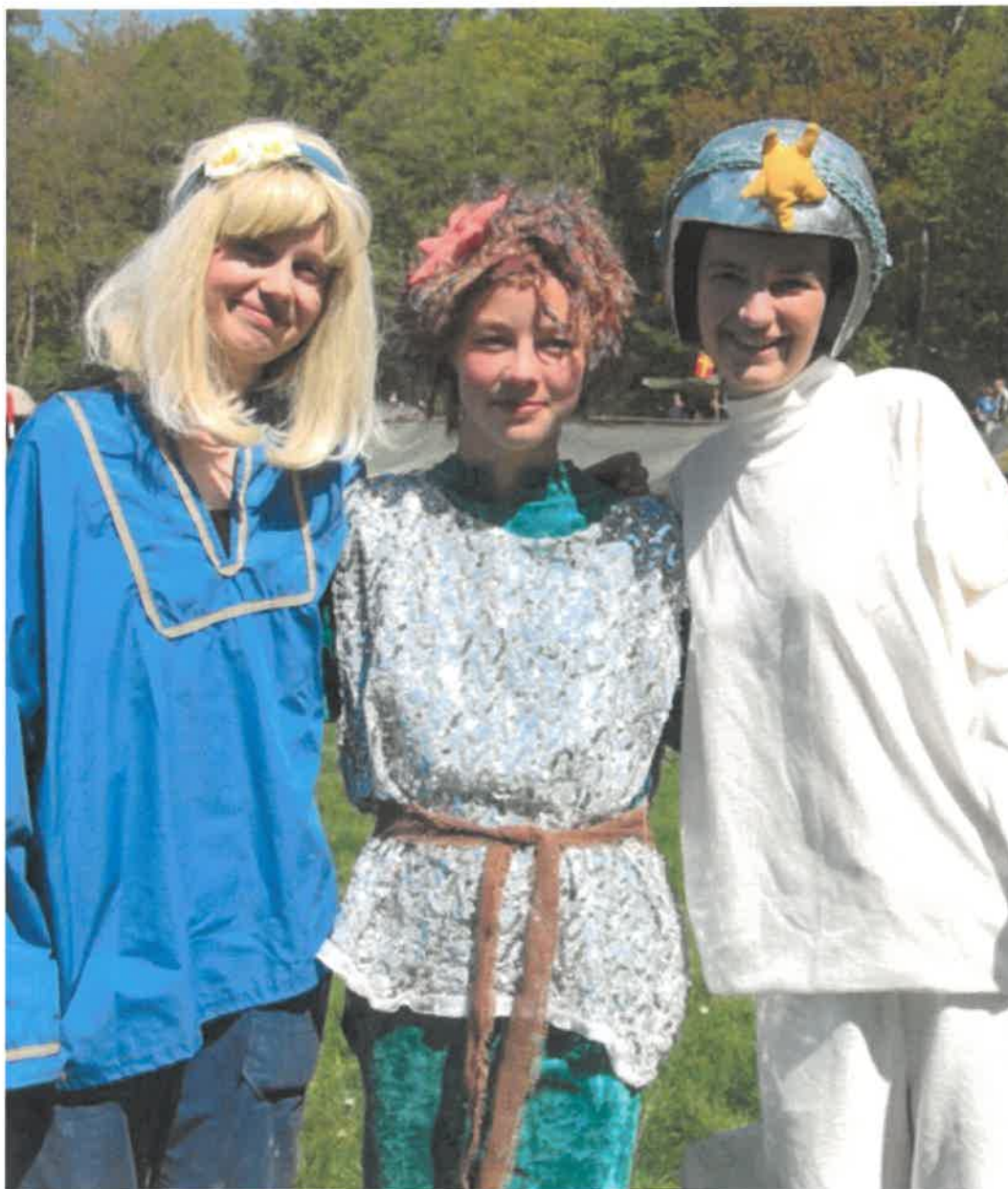
Fjällfina, Laxe och Nova är några av Mulles vänner.

Vi är också extra glada åt att 3 skolor under 2023 valde att utbilda pedagoger för att kunna erbjuda konceptet Skogshjältarna i Lunds Waldorfskola, Uggleskolan och Österskolan.