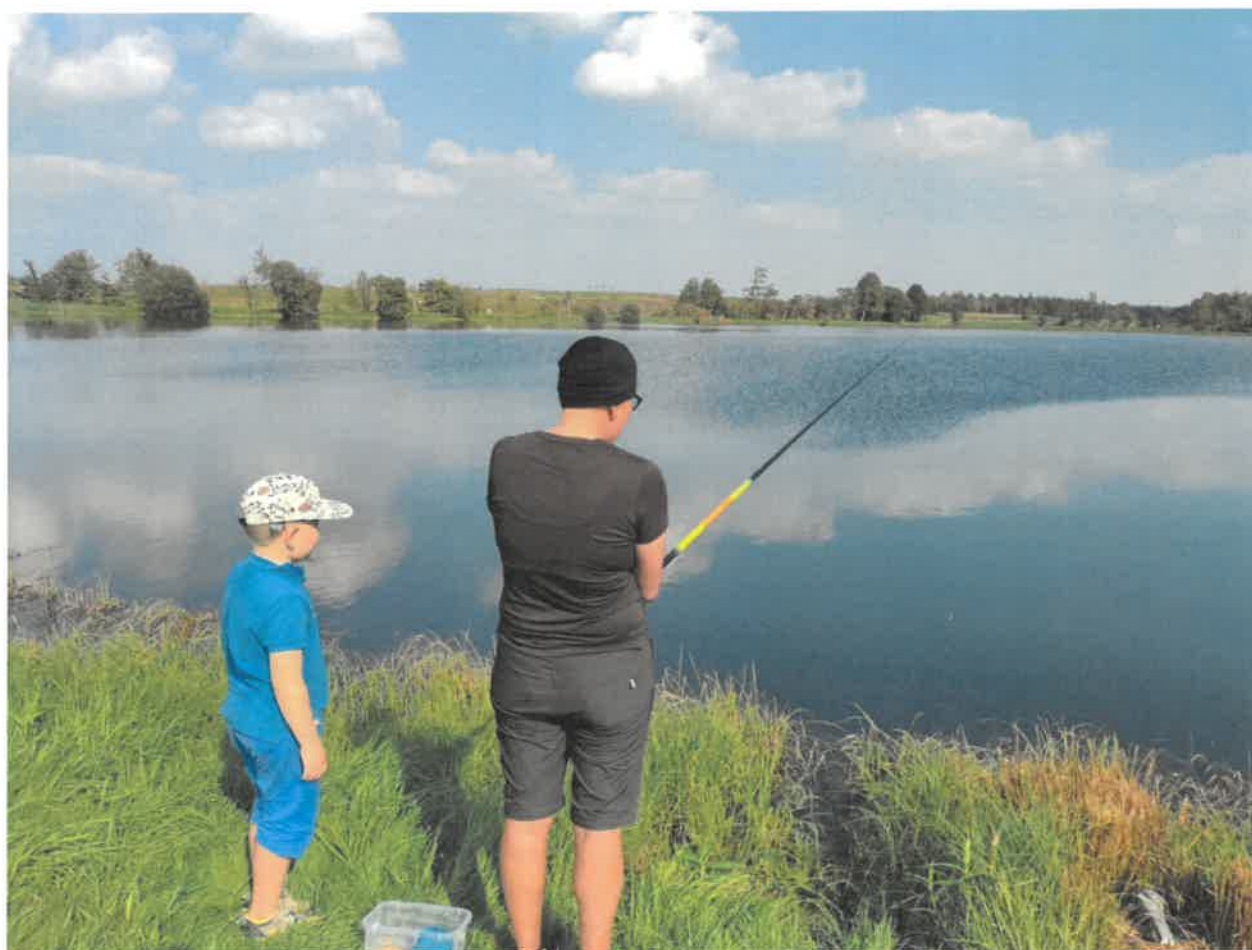
Fiskekurs för ledare med SportFiskarna i Rögla Dammar