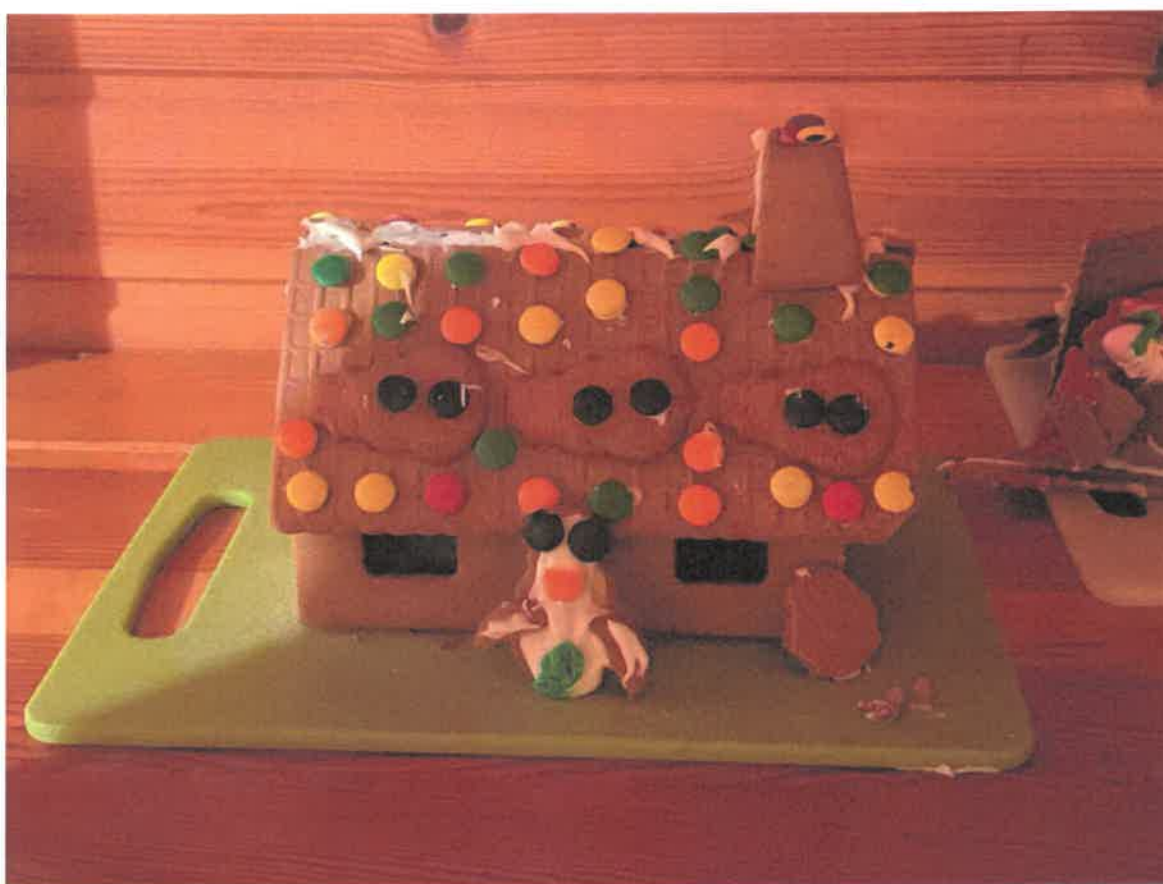
Stuguhäng i Stockstugan med lufsargruppen Skogens Honung