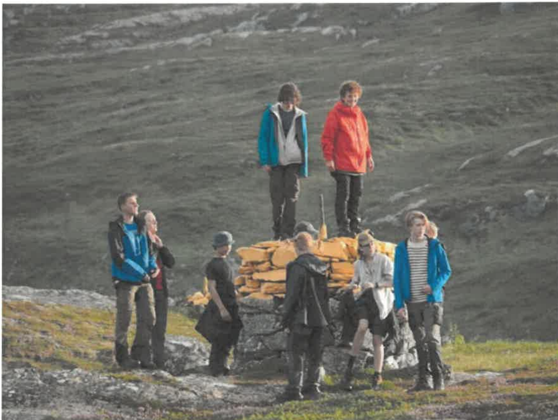
Det är denna fjällvandring alla frilufsare och TVM:are längtar efter!