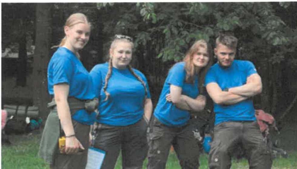
Några av Sommarlägrets bästa arrangörer och funktionärer