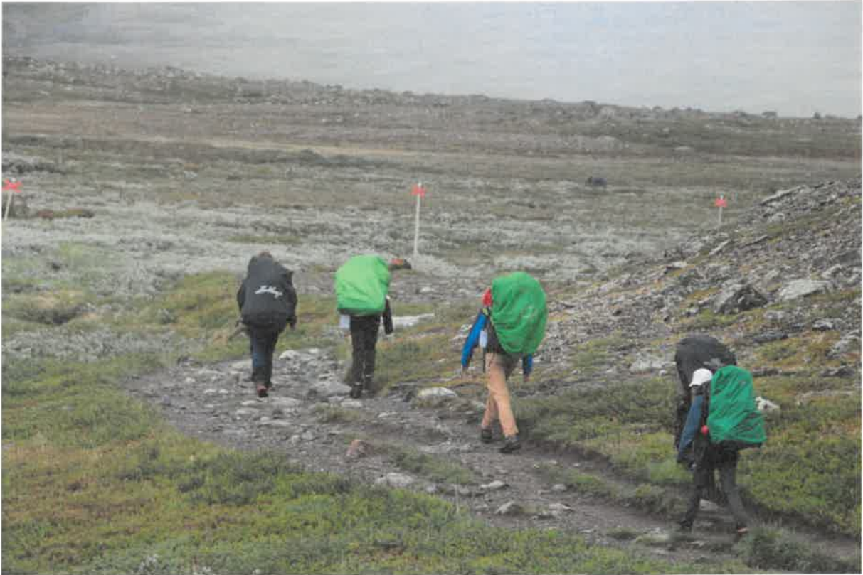
Enveckas fjällvandring i Jämtland