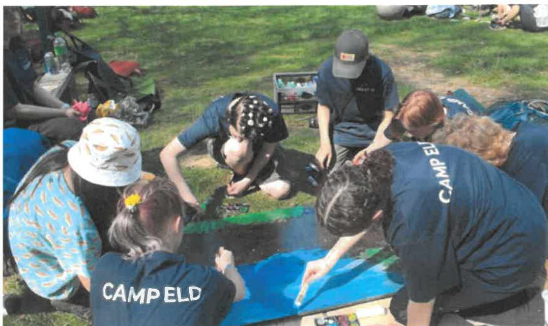
Det målas för fullt på Camp Eld