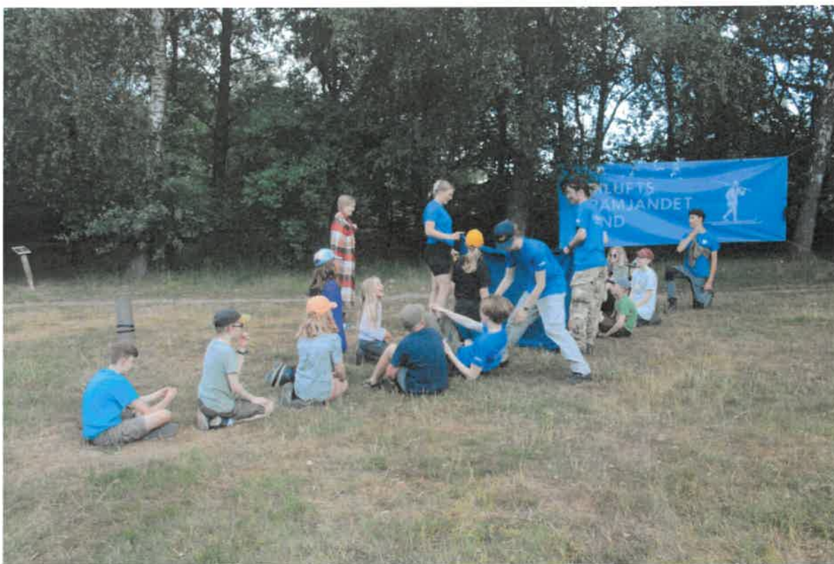
Skoj och skratt hos ungdomsledarna och barnen på Sommarläger i Skrylle