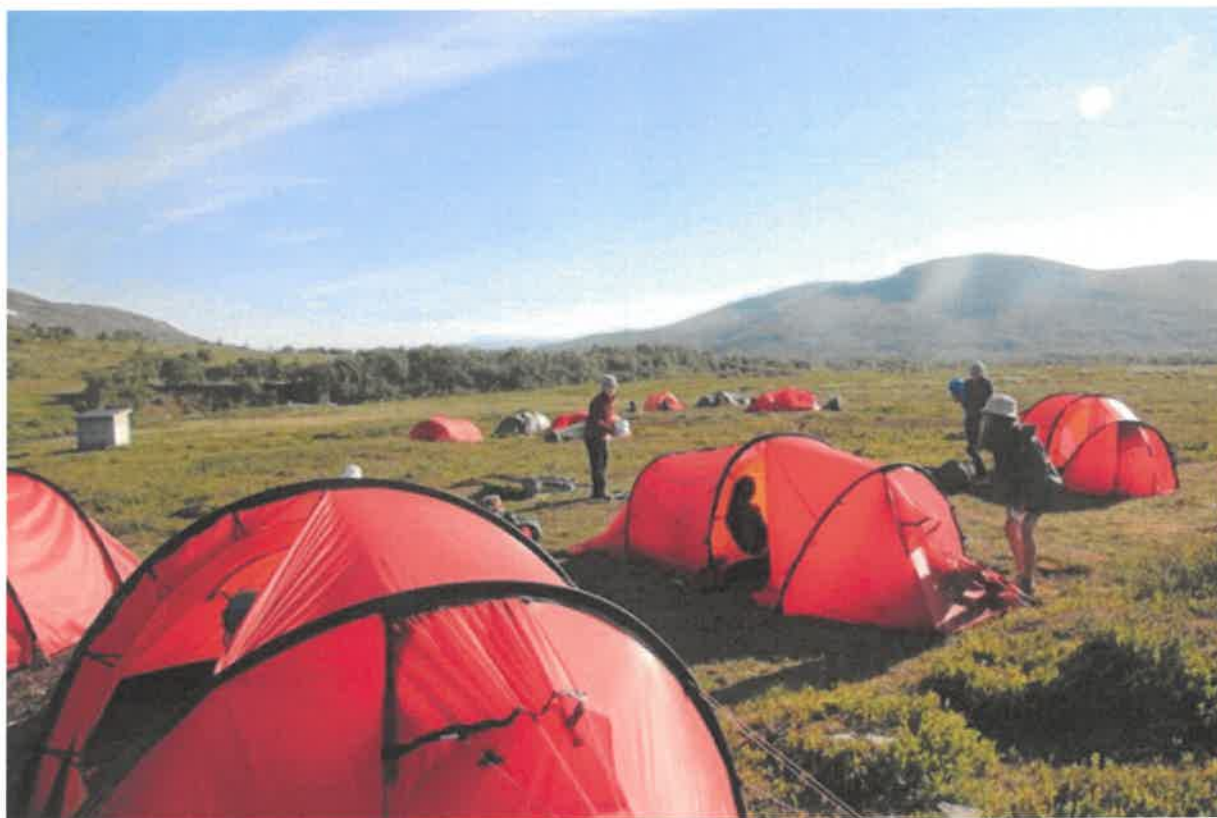
Glada miner under fjällvandringen!