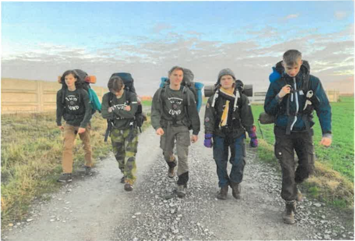
Våra TVM:are håller en vandring på Öland!