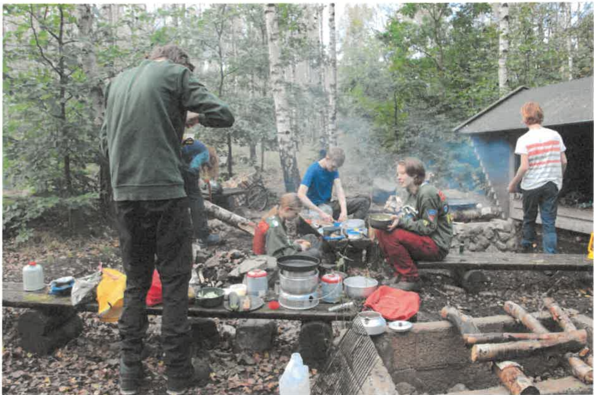
TVM Gourmethelg