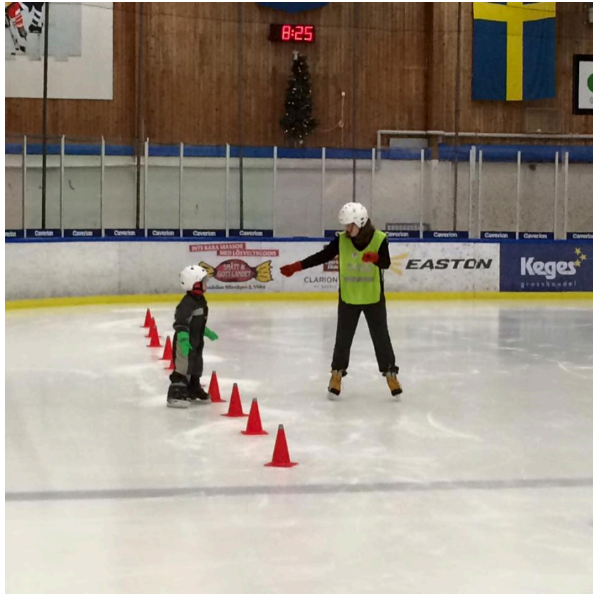
Skrinna Skridskoskola 2016

Innehåller vandrings- och paddlingsprogram för 2017