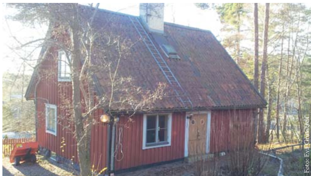
Grindstugan på Torekällberget – vår föreningslokal.