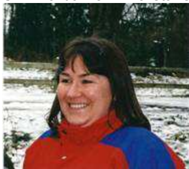
I skogen 2005

bort en hel kilon från sin kropp. Det kunde vi notera när hon susade fram på isen med Skrinna-barnen i Märsta Ishall under december månad.