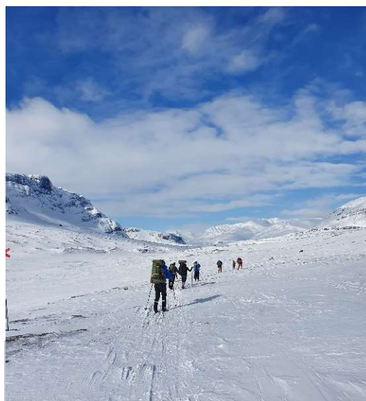
På väg mot Singi

* Skidtur från Vakkotavare till Ritsem 1 - 10 april, 8 deltagare. En tur med många strapatser och utmaningar för ledarna. Stor spridning bland deltagarna i fråga om ork och åk teknik. När gruppen på tredje dagen kom till Singi blev man tvungen att överväga om man skulle fortsätta enligt plan. Prognosen för nästa dag var ökande kraftig nordlig vind, det var djup fluffig nysnö och sträckan var 28 km. Väderutsikterna för de kommande dagarna var inte heller gynnsamma. Ledarna beslöt därför att nästa dag vända om och skida tillbaka till Kaitum. Dagen därpå fortsatte man till Teusajaure och nästa blev en dagstursdag respektive vila för de som var sjuka. På grund av prognosen för sista dagen som spådde snöfall och vind som skulle öka till 26 m/s under eftermiddagen startade gruppen tidigt på morgonen och de två friska ledarna turades om att spåra i den djupa snön. Tack vare detta nådde man ner till björkskogen ovanför Vakkotavare innan det blåste upp. På lördagen några timmar före avfärd fick man besked om att det hade gått minst två laviner över vägen och att bussen skulle vända i Stora Sjöfallet samt att det skulle ta två dagar att röja vägen. Efter ett raskt ingripande