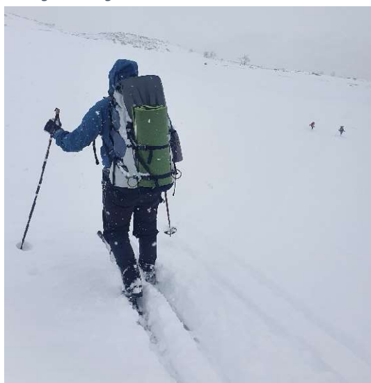
Nedför backen i djup snö.