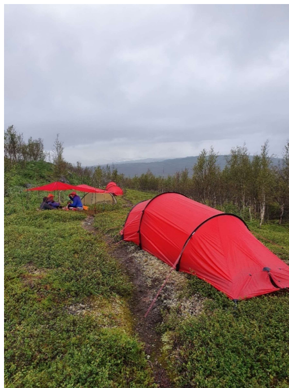
Nattläger med tarpen som kom till stor användning under turen.

* Tälttur i tre nationalparker 15 – 24 juli, 4 deltagare. Ledarna fick avslag på ansökan till Länsstyrelsen om tillstånd att gå i Sarek. Det fanns ingen motivering till avslaget, men möjligen berodde det på att samernas kalvmärkning i området var försenad och därmed kunde bli störd. Detta innebar att vandringens sträckning fick planeras om dvs inte gå i Sarek. Dessutom blev en deltagare sjuk under vandringen och gick mycket långsamt så vandringen fick läggas om och kortas ner ytterligare. En deltagare och en ledare blev sjuka strax innan avfärd. Så gruppen kom till slut att bestå av fyra deltagare och en ledare. Dock fanns det en kanotledare i gruppen som stöttade när det behövdes. Det regnade i princip under hela vandringen. En deltagare hade gått in för lättviktspackning inklusive kläder och mat och blev därmed frusen, vilket påverkade humöret. Trots alla svårigheter var deltagarna nöjda och undrade var vandringen skulle gå nästa år.