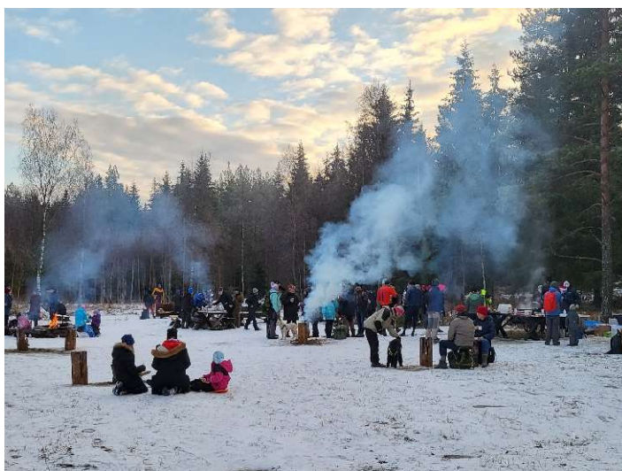
Full fart vid Lunsentorpet på Lucia 2021.

Det årliga arrangemanget med Lucia på Lunsentorpet i samarbete med Uppsala kommun och Knivsta kommun samt Friluftsförbundet Knivsta arrangerades söndagen den 11 december. TVM värmdde upp stugan och skorstenen med eldning och utsmyckning. Två ledare ledde en vandring från Flottsundsbron till Lunsentorpet. På plats ställde även några funktionärer från Friluftsförbundet upp och bidrog bland annat med tomte, kaffekokning och pinnbrödsbakning.