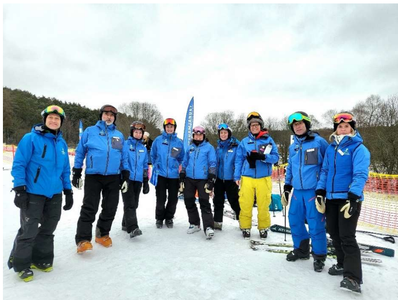
Skidledare i Sunnerstabacken.

Den alpina verksamheten genomfördes under året. Snötillgången i Sunnerstabacken var god på grund av en tidig kall period då snöläggningen kunde ske. Alla backar var öppna för barngrupperna, vilket gav en god spridning i skidområdet och att alla backar kunde nyttjas i kursverksamheten. Under säsongen rådde ännu viss försiktighet för pandemin med spridning av covid-19, vilket gjorde att en del av pandemirestriktionerna kvarstod. Värmestugan höll exempelvis stängd och grupperna var mindre liksom året före.