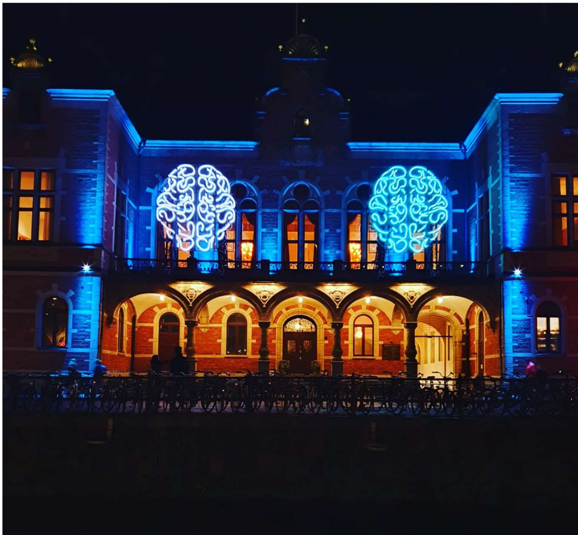
Friluftsförbundet Uppsala vandring Allt ljus på Uppsala november 2022.