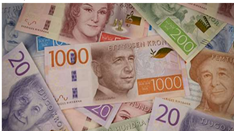
Nya sedlar: Astrid Lindgren, Birgit Nilsson, Dag Hammarskjöld, del av Ingmar Bergman, Evert Taube

I årets budget hade 189 400 kr avsatts för att satsa på utökad utbildning av ledare. 70% av budgeten för detta användes, så satsningen fortsätter under 2023.