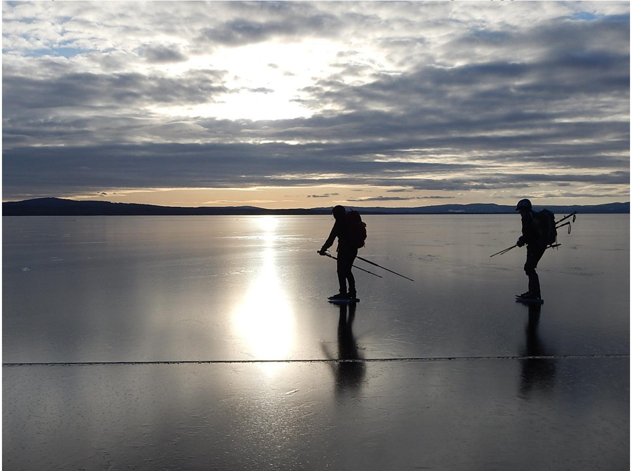
Bild 2. Åkning 15/2 utefter gammal snötäckt is på Rättviken. Skidbacken syns tydligt.

Bild 1 på finisen14/2 en stund före återkomst till Tällbergs brygga.