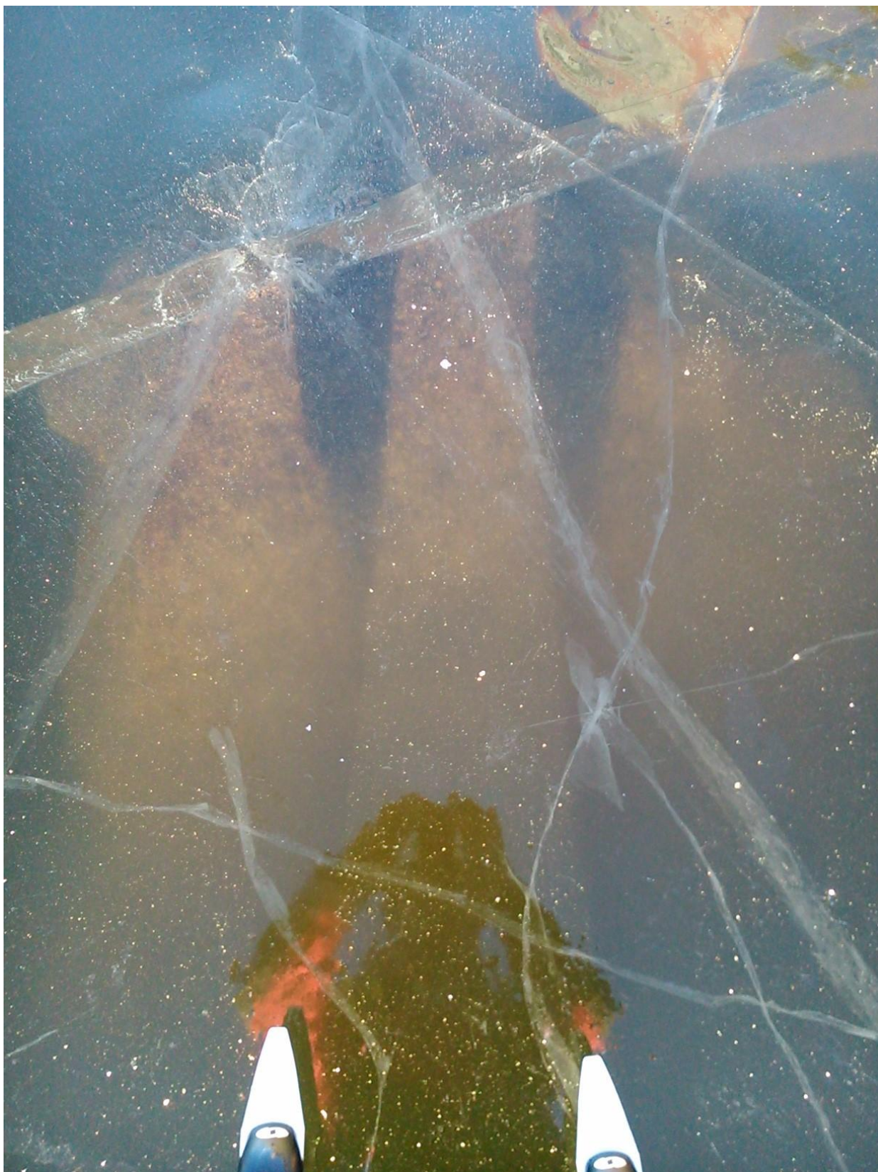
Även stora Valloxen lockade till fartfylld dans. Björnudden solade sig.