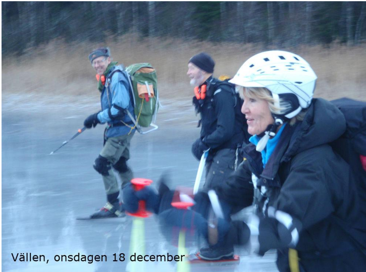
Vällen, onsdagen 18 december