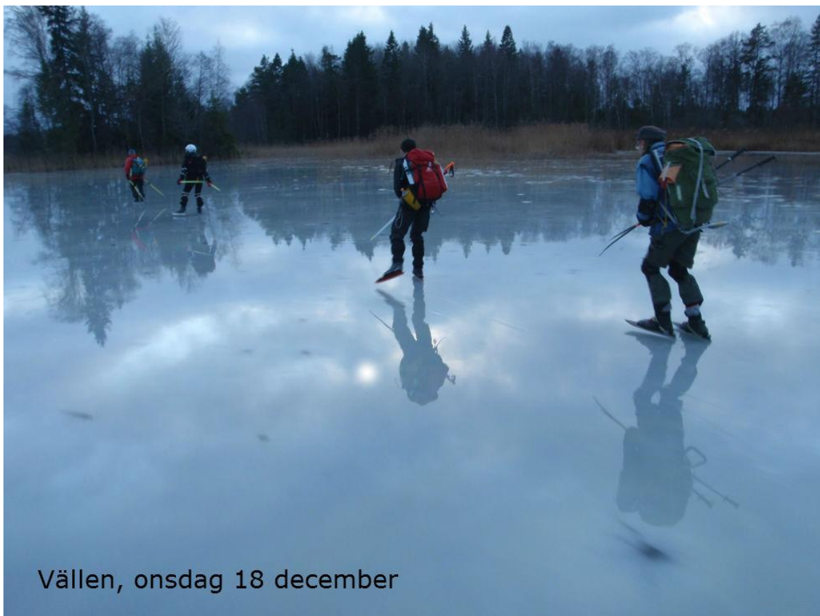
Vällen, onsdag 18 december