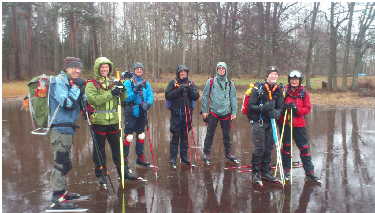
FF Knivsta åker i alla väder. Stordammen vid Österbybruk.